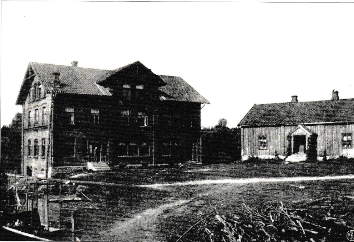
Fossum pleiehjem. Foto: Mansrud. Lånt fra Herman Thoresens bok: Eidsberg herred, 1914.

Det var også en usedvanlig hardtarbeidende stab. Alle hjalp til