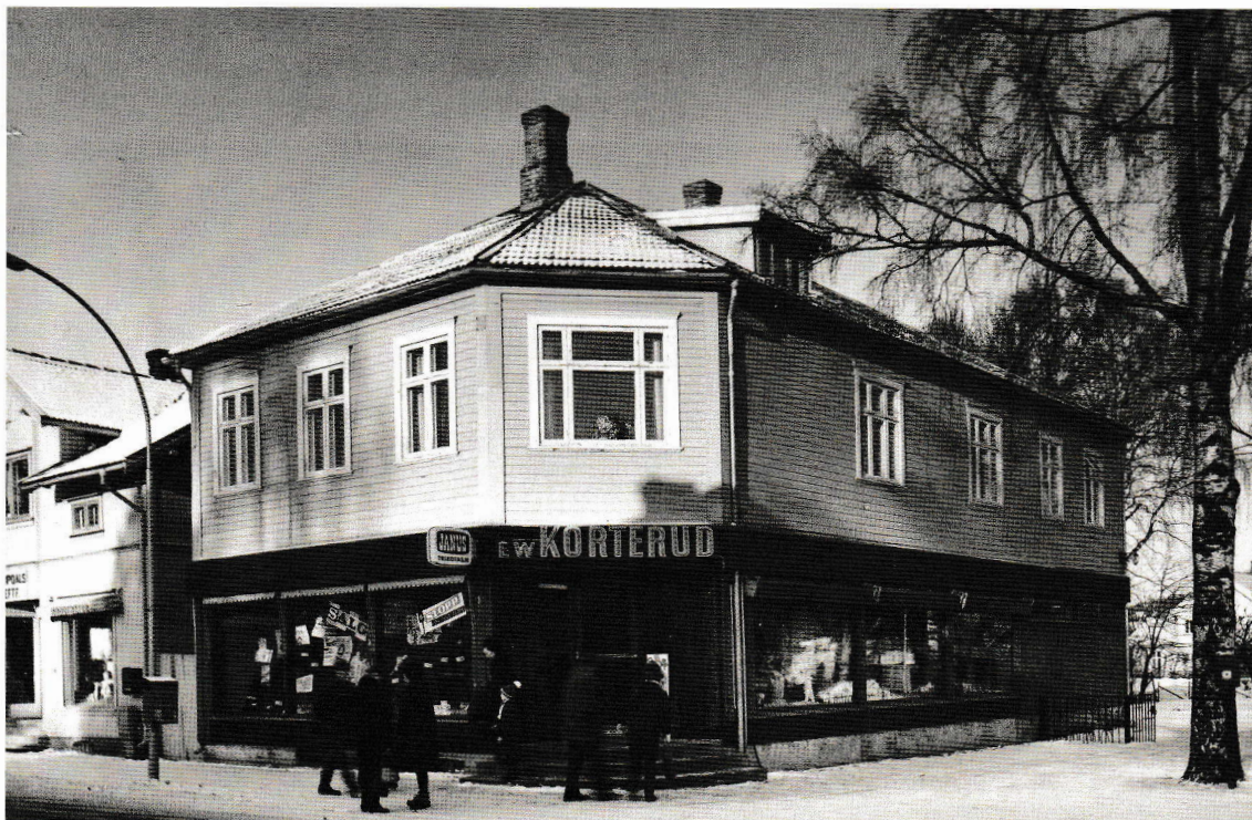
Storgata 11, ca 1965.

Et eksempel kan være Oslo havnelager der Tore hadde et totaloppdrag. Huset består av 4000 kvadratmeter i hver etasje i 10 etasjer, pluss garasjekjeller og loft. Det ble bygd i 1922 som Europas største frittstående murbygg. Det ble reist i løpet av tre år av et team på 2800 medarbeidere. Som eksempler på dimensjonene i totaloppdraget kan nevnes at Tores folk malte og fikk på plass listverk i en lengde fra Nordkapp til Lindesnes og tilbake til Bodø, og at de hang opp 130 000 kvadratmeter glassfiberstrie. Én og én etasje ble