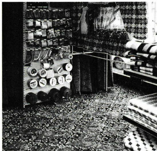
Fra tekstilavdelingen ca 1975.