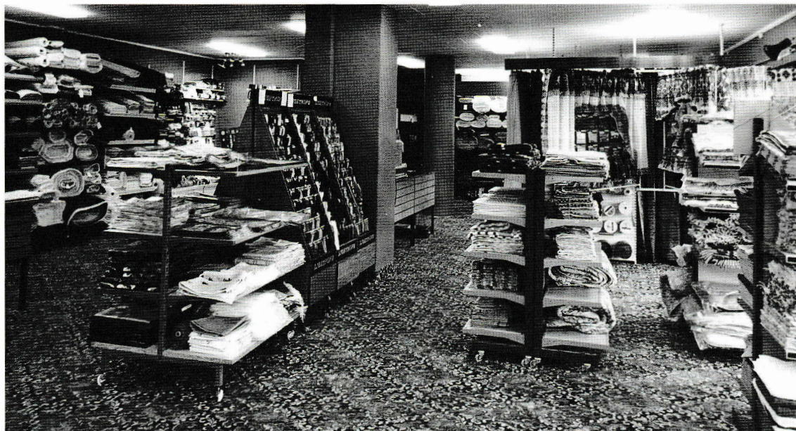
Fra tekstilavdelingen ca 1975.