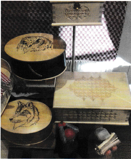
En del av den faste utstillingen.