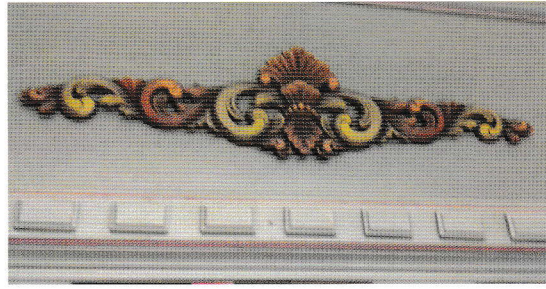
Husflidens hus. Ranke over inngangen?

I år feiret Indre Østfold Husflidslag, lokallag i Norges husflidslag, sitt 40-års-jubileum. Det startet som Mysen og Omegn husflidslag. Etter fem år skjedde et navneskifte til Indre Østfold