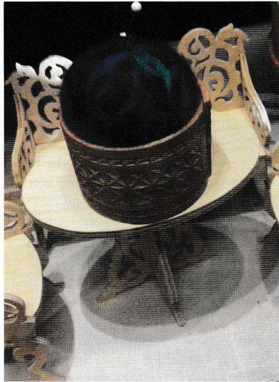
Nålepute i luksusklasse.

Kolrosing er et «bilde» skåret inn i veden. En saus av malt bark (noen