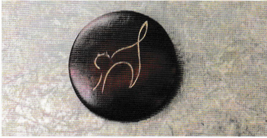
Smykke med kolrosing i hvitt.