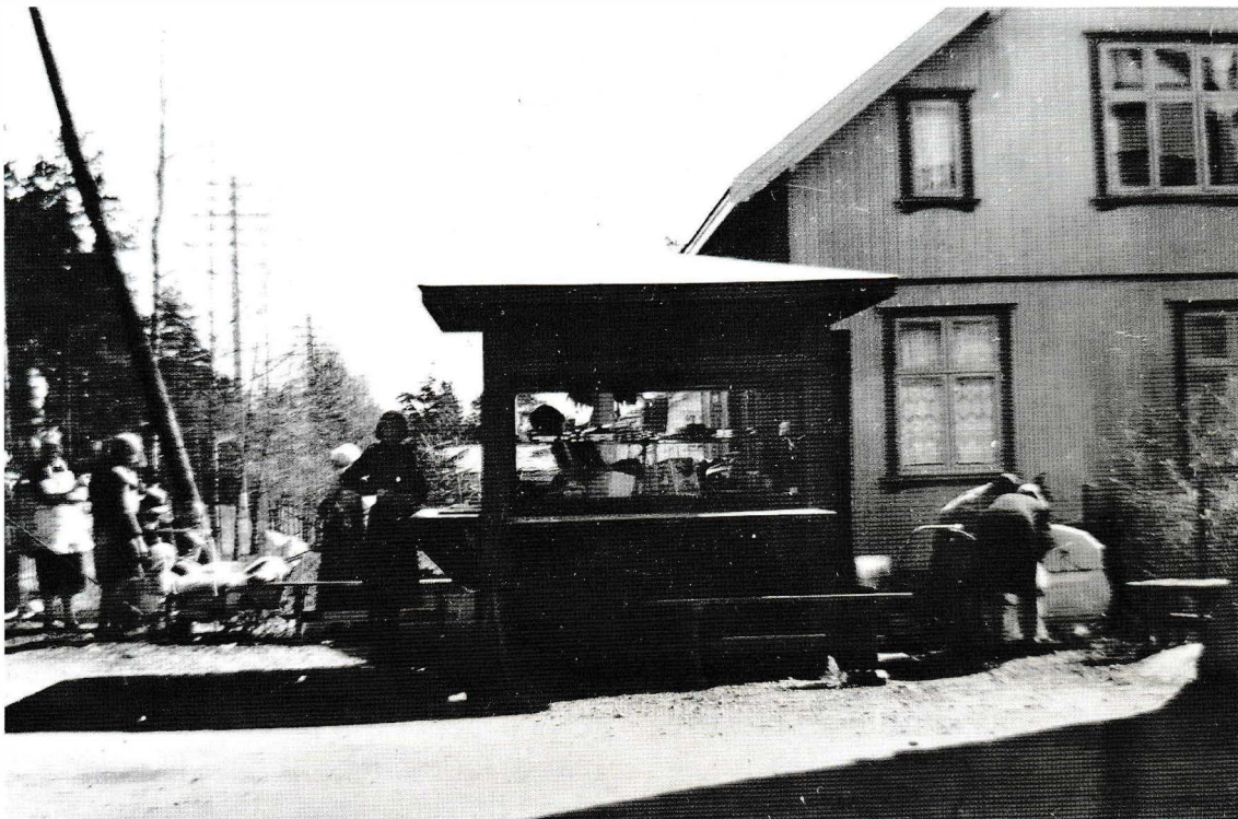
At det var stor trafikk i kiosken under travkjøringene ser vi av dette bildet fra 1930-tallet.