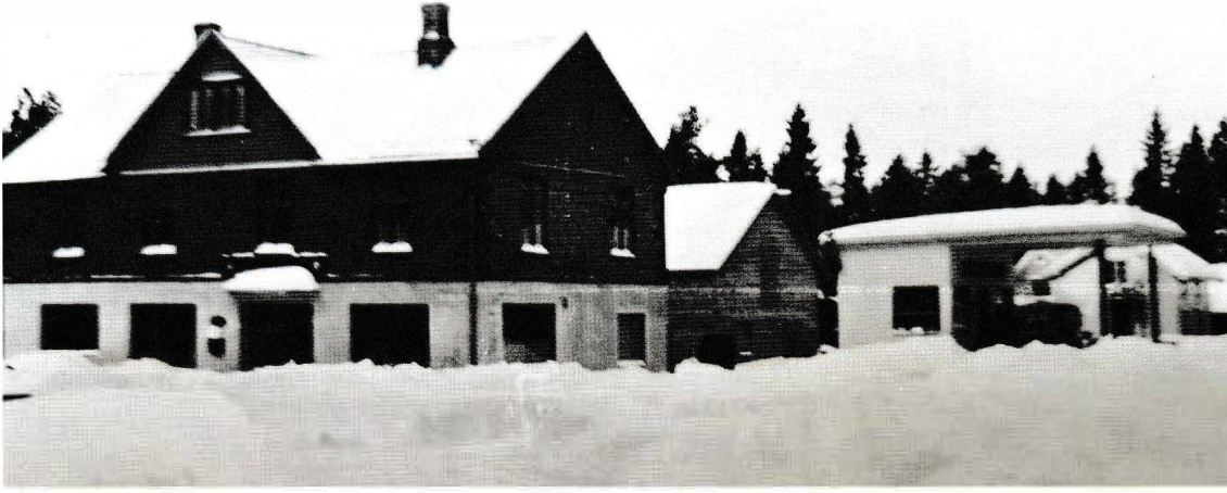
Momarken landhandel etter et stort snøfall etter at bensinstasjonen ble oppført. Lageret skimtes i midten.