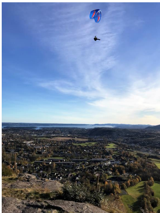
Utsikt fra Solefjellstuveien.

I Bærum har vi fått positiv tilbakemelding fra «Natur- og idrett», men det er nok ikke bare å sette i gang. Her må det grunneiertillatelse og byggetillatelse på plass. Så er det penger.