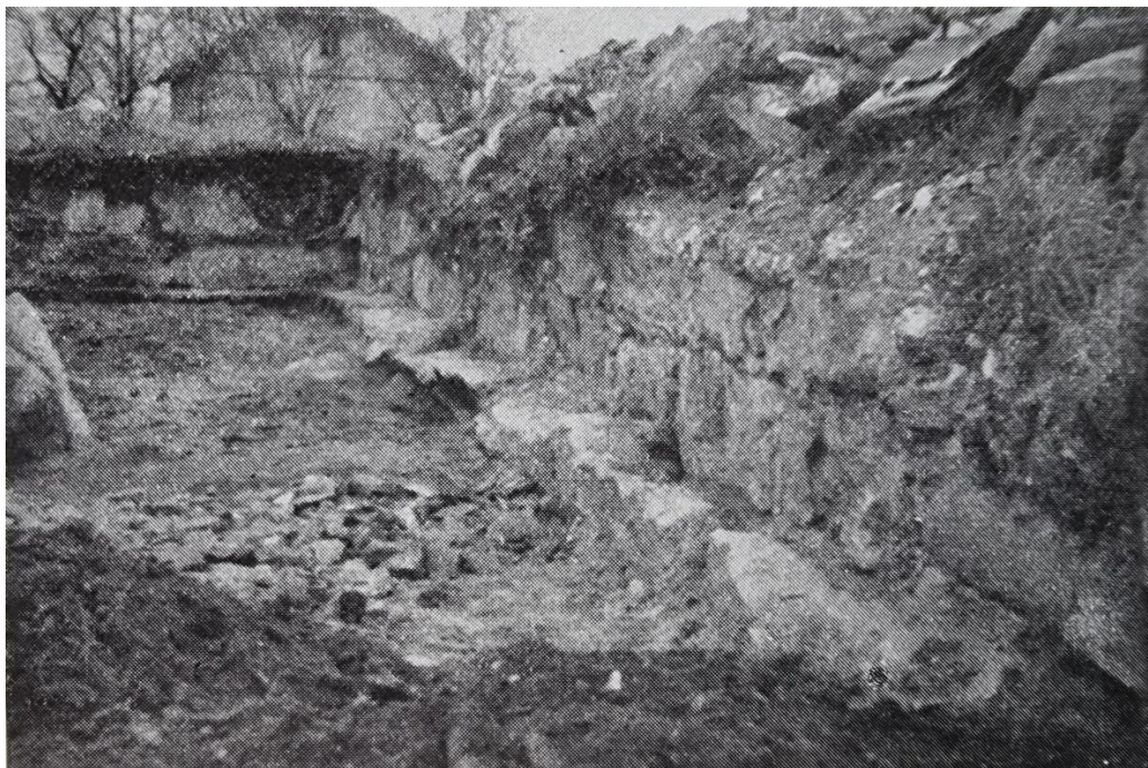
Nordre del av vestveggen og nordveggen