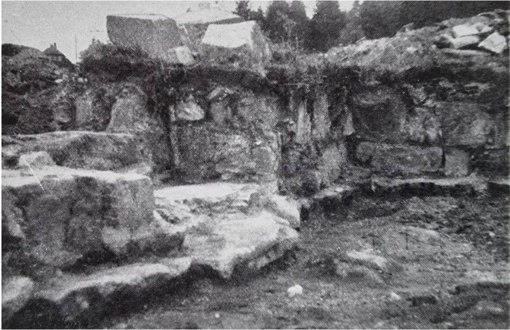
Bilde fra inngangsdøra mot vest

Kirken har hatt dør midt på vestveggen og antagelig ei dør på sydsiden samt to vinduer vest for denne inngangsdøra. Over alteret har det kanskje vært et vindu. På nordsiden har det ikke vært noen vinduer i det hele tatt, fordi folk den gangen var ikke så lite overtroiske, og de mente at de onde åndene kom nord fra. Døra som vender mot vest, har vært 1,48 m bred, og åpningens nordre side er murt noe skrå for å gi plass til døra, som har slått inn mot den.