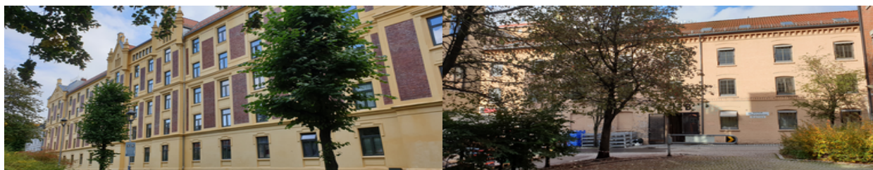
Heimdalsgata 26 og Grønland 12 B.