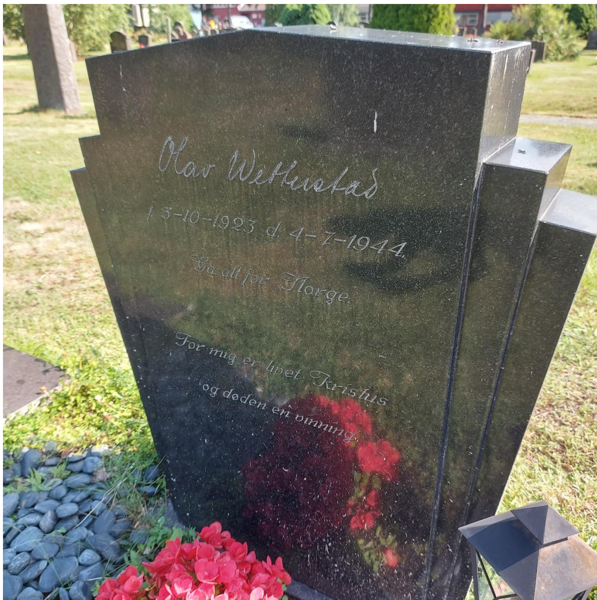
Olav Wetterstads gravstein. Fotografert juli 2021 av Dag Kristoffersen.