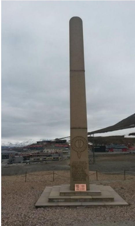
Bauta reist av arbidere og funksjonærer ved kullkompaniet.

Seinere er det også satt opp en plakett på Akershus festning over de som omkom i de norske styrkene i Skottland.