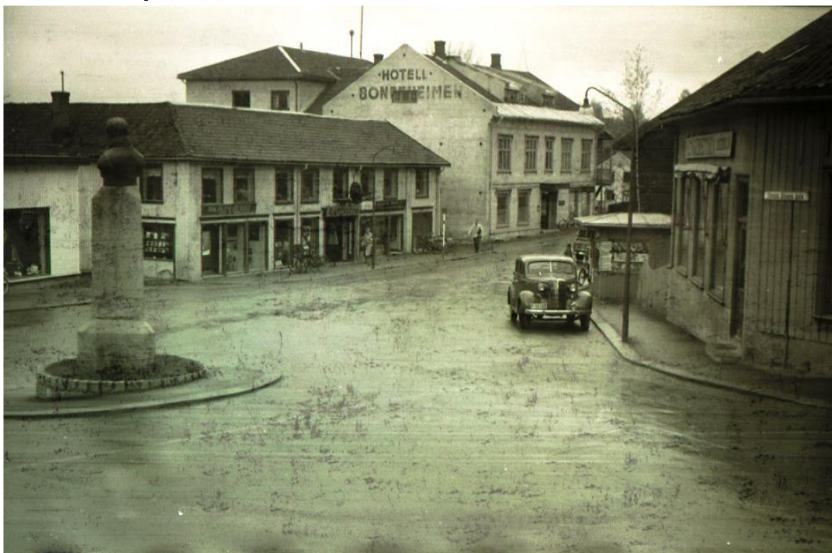
Bondeheimen og Howlidgården 1951