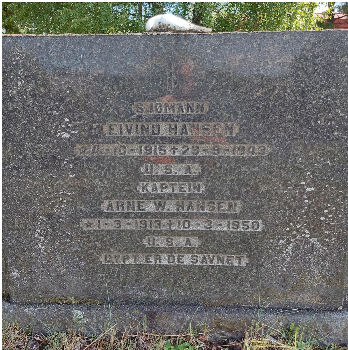
Gravstøtte Eivind Hansen. Rensa for mose og avfotografert juli 2021 av Dag Kristoffersen