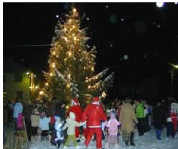
Julegrantenning og godteposer til barna