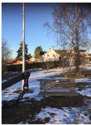
Benker og dugnad på fellesområder