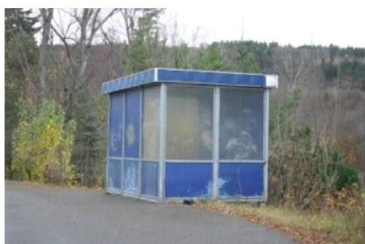
Gammelt og nytt busskur