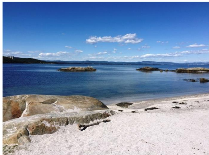
Ellefen – skjellsand og vedlikehold