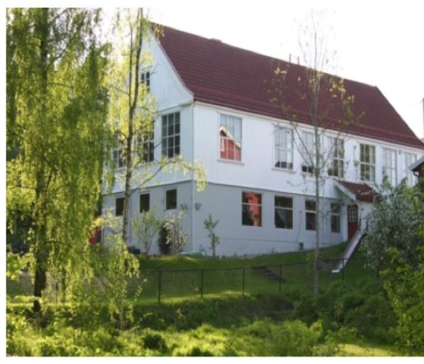
Grendehuset – fest og møtelokale reddet fra forfall