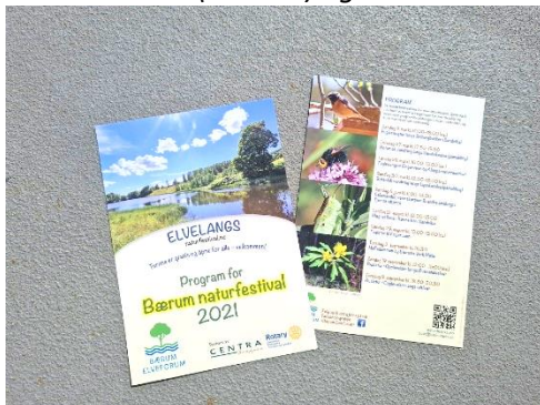
Bærum Naturfestival «Elvelangs 2021» foregår i disse dager og helt fram til høsten. Se www.naturfestival.no for program.