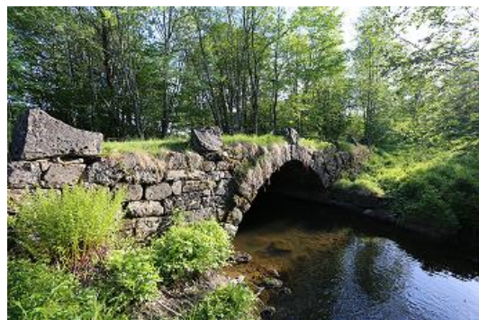
Gunnar Fimland driver skjøtsel ved gamle Øverland bro.