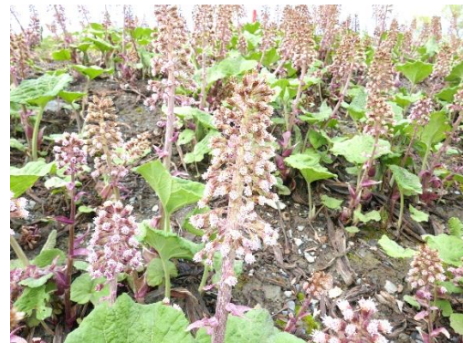
Den skadelige fremmede arten legepestrot arbeides det fortsatt med for å bli kvitt.