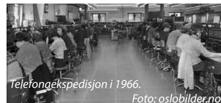
Telefonaekspedisjon i 1966.

Telegrafbygningen ble Telenors hovedsete, og fram til midten av 1990-tallet landets viktigste telesentral. Det var her det skjedde. Hit kom meldinger om krig og