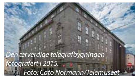
Den ærverdige telegrafbygningen fotografert i 2015.