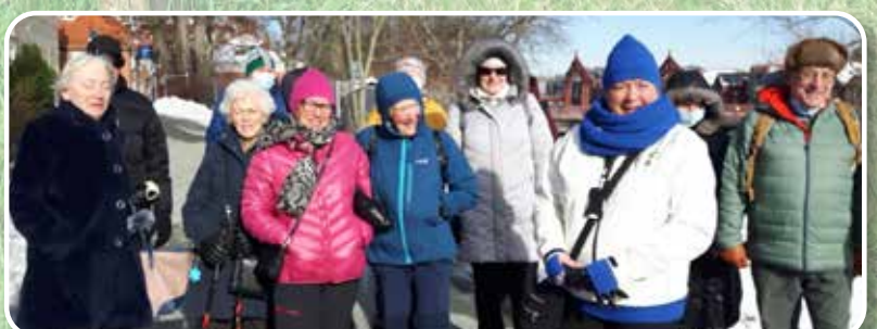
Trønderne går og går