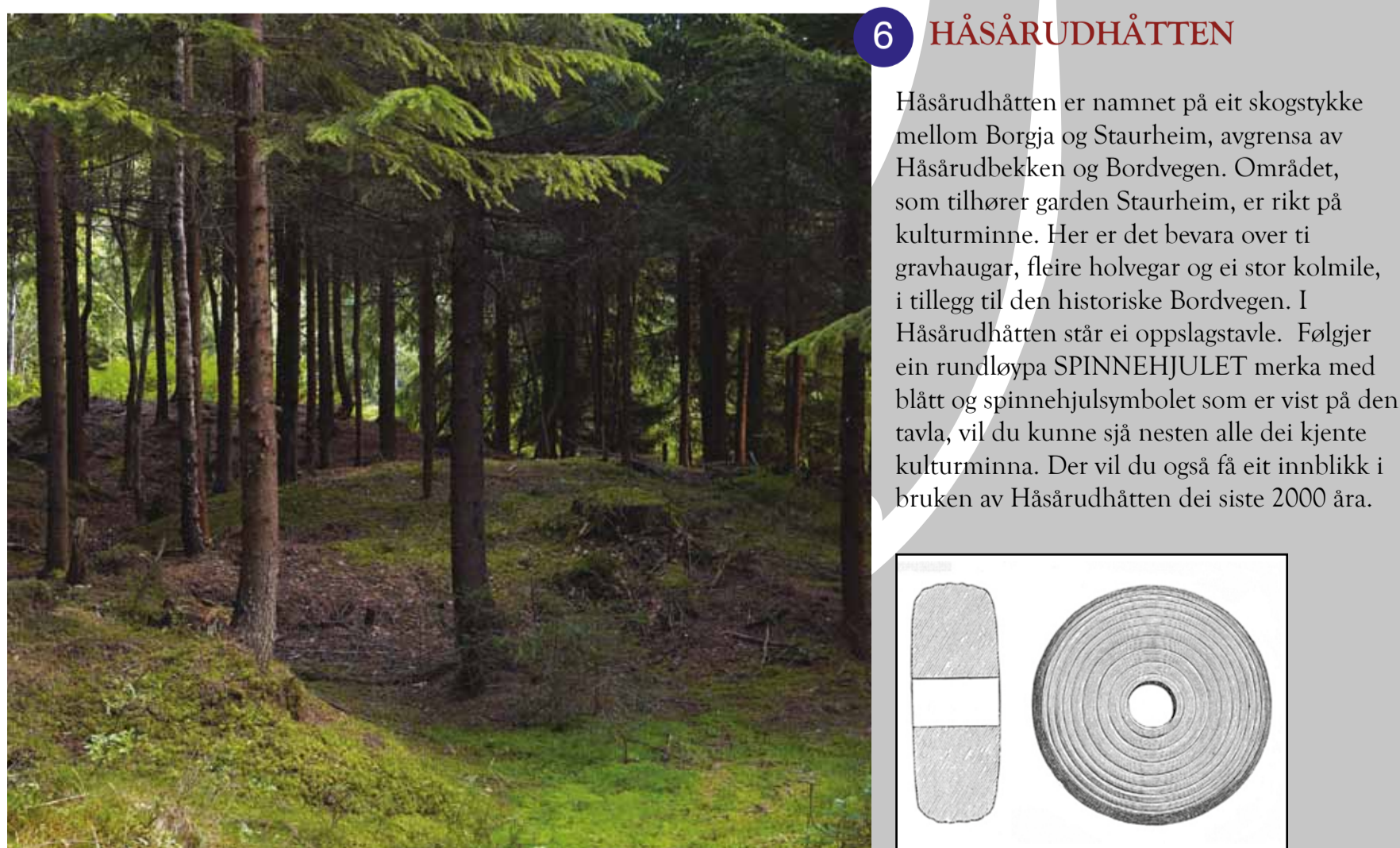
Bilde frå område i Håsarudhåttan.