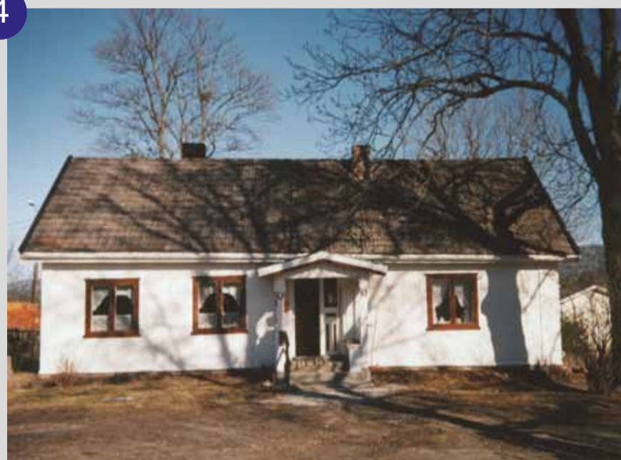
Den gamle bygningen i Veirud der det var meieridrift.

Det fyrste meieriet i Bø og Telemark fylke vart oppretta og byrja i Veirud 18.11. 1869. Det var eit andels foretagende som nokre få gardbrukarar stod bak. Innlevert mjølkemengde var ikkje stor, bare dagleg 400 pottar (1 pott = 0,9651 L) mjølk om dagen, til ein pris av 2 1/2 skilling pr. pott. Ein gammal mann (Olav Glena) har ein gong fortalt at han som ung gut bar mjølk frå garden Borgja i bakmeis på ryggen til "Veirud-meieriet", som han kalla det. Der kjøkenet var i den gamle stovebygningen som no er rivn, var det meieriet hadde tilhald. Men så brann uthusa i Veirud, som nok også har vorte nytta til meieriet, og meieriet blei lagt ned i 1872.