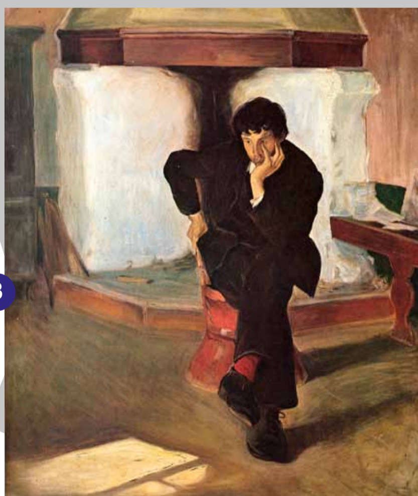
Drommeren, måla av Halfdan Egedius, Torleiv Stadskleiv sitt modell i Bostugu.