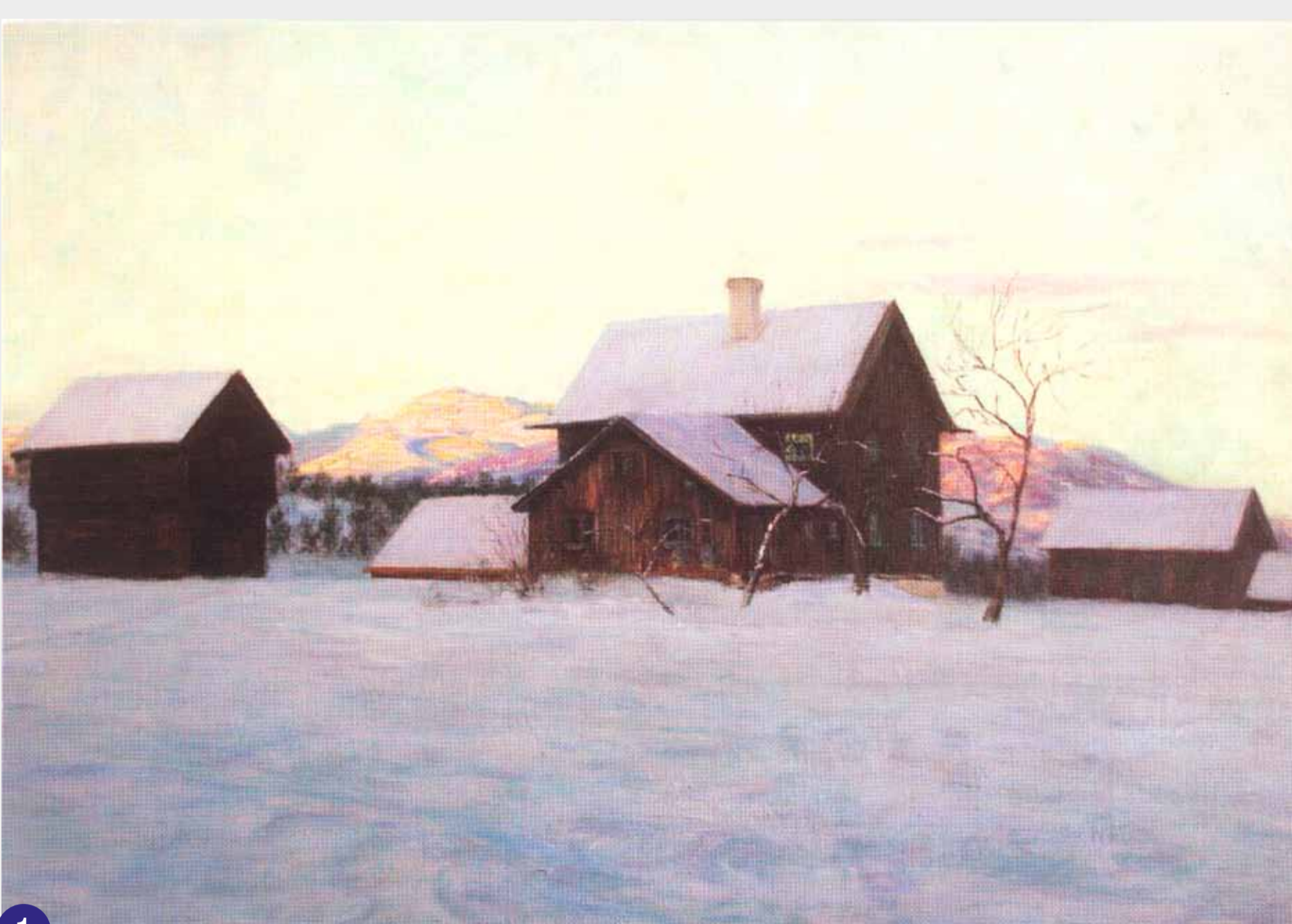
Nerbo, måleri av Torleiv Stadskleiv.