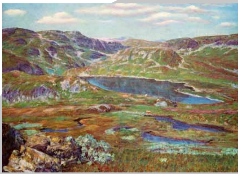
Frå Lifjell. Måla av Torleiv Stadskleiv