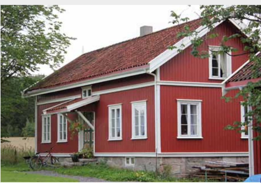
Ysteriet på Staurheim.