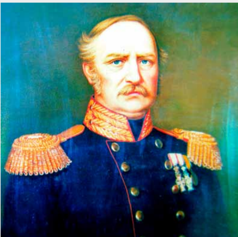
General Olaf Rye frå Bø.