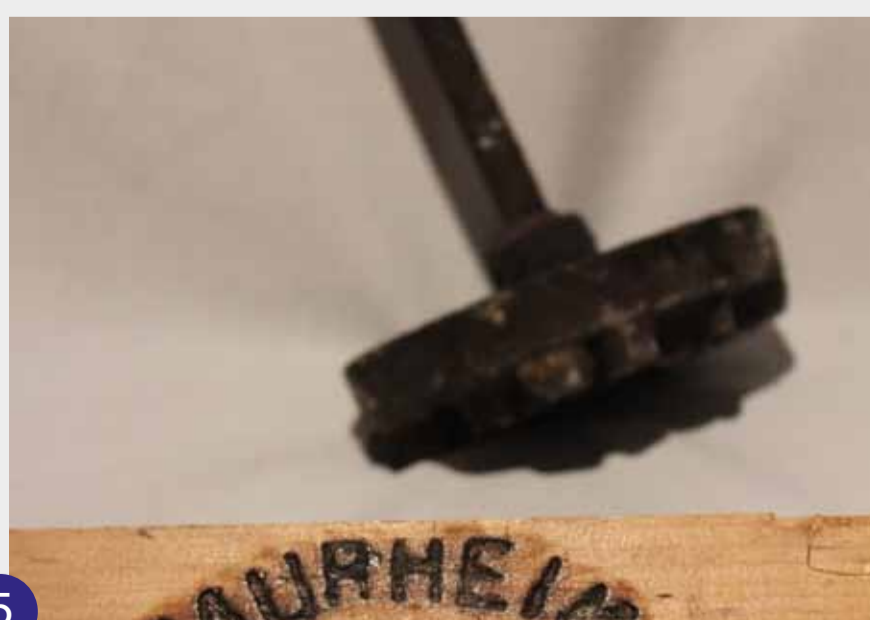
Gammelt stjern til merking av ost.

På Staurheim drev dei med ysting i 1870-80 åra, det er eit eige lite hus på garden som vert kalla Ysteriet, dette huset er nå restaurert, og står den dag i dag på Staurheim.