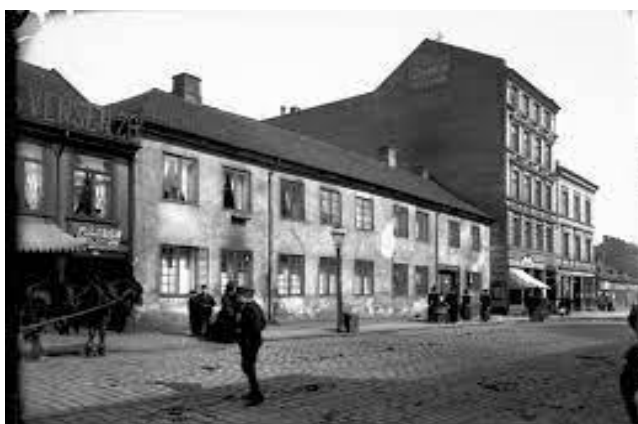
«Asylet» ligger der det ligger – den dag i dag – 2021.