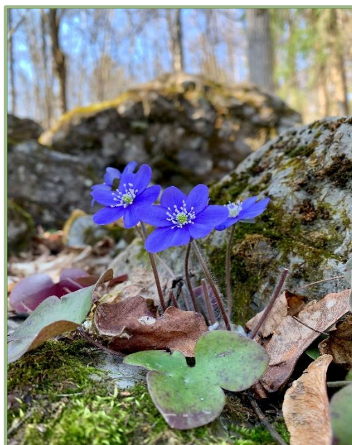
Blåveis i Arboretet

nærheten – buss som alle dager passerer hvert 15. minutt mot Lommedalen og mot Bekkestua. – Det kan jo også være verdt å markedsføre. – Særlig hvis sonегrensen for betaling slutter å gå ved Griniveien!