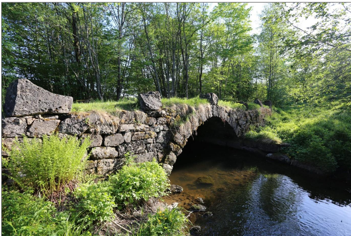
Den vakre steinbroa nedenfor Øverland gård.

Vi er heldige i vellet vårt som er omgitt av så mange fine turmuligheter. I tillegg har vi flere små bekker og til og med et helt vassdrag som bidrar med mangfold av biotoper for både flora og fauna. I denne mini-artikkelen har Furubakken Vel fått låne bilder fra Terje Bøhler i Bærum Elveforum til å formidle og forhåpentligvis inspirere med informasjon om Øverlandsvassdraget.