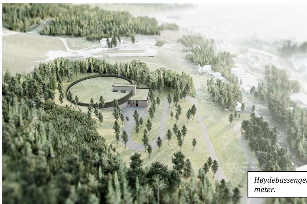
Høydebassenget får en diameter på 70 meter.