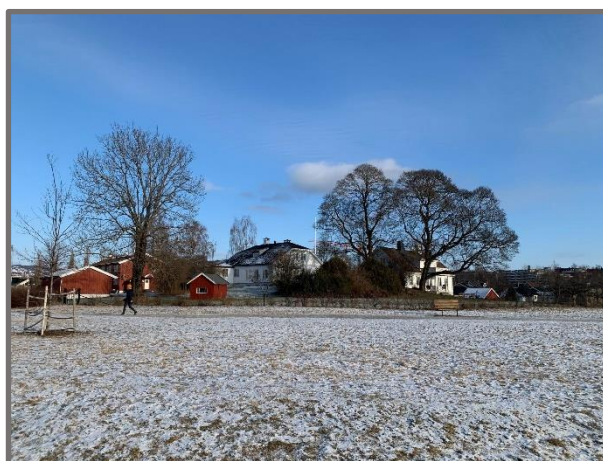
Fra Gjønnesparken som har blitt en stor suksess

Furubakken Vel har sammen med de fem vellene rundt Bekkestua etablert Forum Bekkestua . Målet er å jobbe sammen opp mot handelsstanden og Bærum kommune om utviklingen av Nadderud- og Bekkestua-området. Forum Bekkestua har møter etter behov. Ellers jobber vellene med sine spesielle saker, og holder hverandre orientert og fremmer felles saker der vi mener det er viktig. Vi har dette året hatt mindre møter – og latt byggingen foregå som den gjør. Kaoset underveis er det lite vellene kan gjøre noe med.