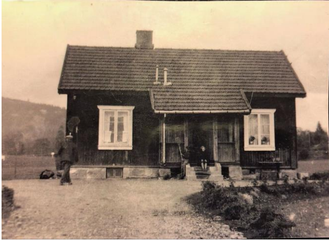
Figur 4 : Bjerkebakken 13- for ca 100 år siden.

hver enkelt sak, men har på prinsipielt grunnlag uttalt seg om verdien av å bevare Røas historie og stedsidentitet. Denne uttalelsen finnes på Røa Vels hjemmeside.