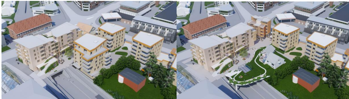
Figur 2: Skanskas planer til venstre hvor 3 av 4 boligblokker er illustrert (blokk 4 er i Griniveien 4a i høyre kant av bildet). Til høyre forslag fra Røa Vel hvor bebyggelsen i Vækerøveien 201 blir bevart- og hvor det potensielt kan bygges et lokk over deler av T-bane- stasjonen. Nytt bygg i Vækerøveien 197 og 199 er illustrert i begge bilder- dette bygg er på planleggingsstadiet pr mars 2021, mens et eventuelt nytt bygg i Vækerøveien 203 ikke er bestemt- kun potensielt illustrert- og ikke vedtatt. Det gule huset som vist i bildet til venstre er derfor det som p.t. blir liggende der.

Røa Vel har siden februar 2018 vært den organisatoriske pådriveren for å få til en helhetsplan for utviklingen og utbyggingen av Røa sentrum. Dette engasjementet er godt kjent fra tidligere årsrapporter.