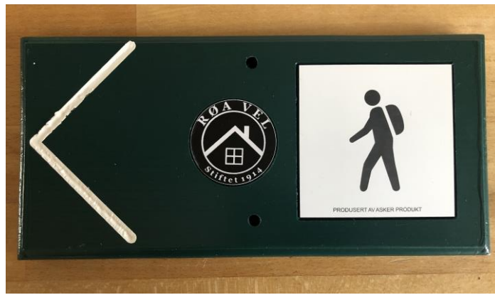
Figur 11: Røa Vels nye skilt for merking av snarganger og turveier