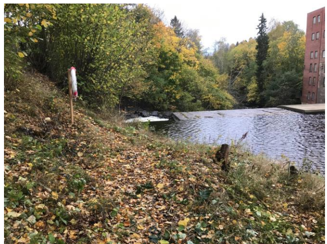
Figur 7: Grinidammen og turveien langs Lysakerelven er populære utfartssteder.

Opprusting av denne plassen var et hovedprosjekt i 2019. I 2020 ble det foretatt noen sluttarbeider og utplassert en balansesti. Oslo kommune v/Bymiljøetaten sørger for det løpende vedlikeholdet. Plassen fremstår nå meget attraktiv og er mye brukt. Akersposten hadde en fin reportasje om prosjektet.