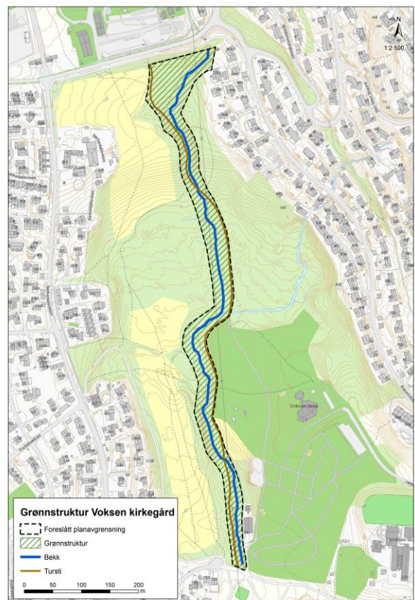
Figur 9: Illustrasjon av området på hver side av Mærradalsbekken som ønskes reulert til turvei

Turveien ved Mærradalsbekken kan med stor sannsynlighet bli regulert til turvei og dermed bli oppgradert. Vinteren 2020 hadde vi Bymiljøetaten (BYM) på befarings. Vi gikk opp hele