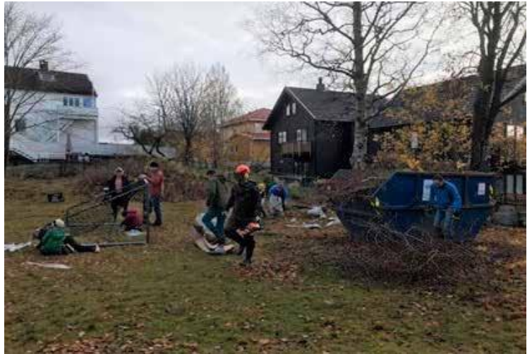
Figur 6: Dugnad på Finnhaugen lekeplass

Opprusting av den grønne lungen og tidligere barnepark ved Finnhaugen/Nøtteveien har vært et nytt prosjekt. Med økonomisk bidrag fra Røa Vel og frivillighetsmidler fra Oslo kommune v/Bydel Vestre Aker har en ivrig nabogruppe på dugnad sørget for rydding og utplassering av nye fotballmål og to parkbenker. Det gjenstår noen sluttarbeider til våren samt å få etablert et løpende vedlikehold i regi av bydelen.