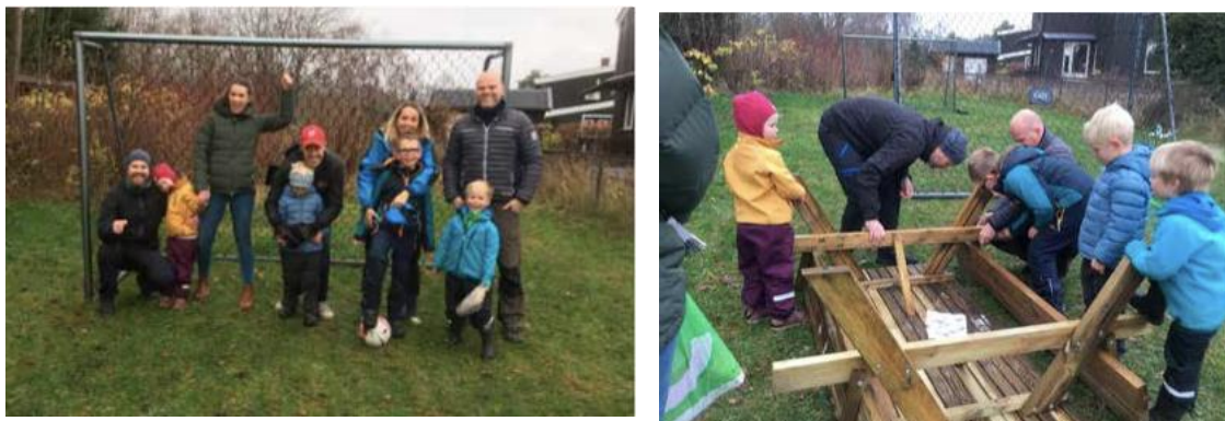
Figur 8: Glade naboer var med å sette i stand Gravdalsveien fotballbane

Naboene klipper gresset og holder den grønne løkka ryddig og pen. De hadde lenge ønsket seg nye fotballmål og en benk og bord der de kan sette seg med litt mat og drikke. En nabogruppe ble opprettet, og de sendte så en søknad til Røa Vel med forespørsel om bidrag til nye fotballmål og sittebenk og bord. Røa Vel var positiv og ønsket å bidra med midler.