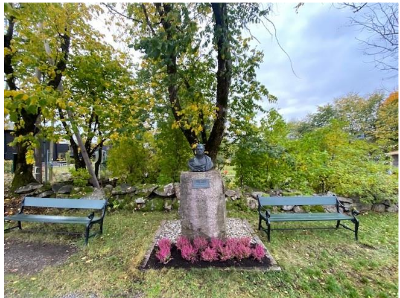
Figur 12: Minnesmerke for Kristian Aubert (til venstre) og statuen av Peder Anker ble ryddet og beplantet høsten 2020

Vellet fikk også god hjelp fra Bogstad skole som påtok seg ansvaret for å holde det pent rundt statuen av Peder Anker- en ordning vi setter stor pris på og som vi håper vil fortsette også i 2021.