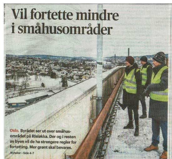
Figur 3 : Aftenposten 14.02.21. Småhusplanen skal revideres- og Byrådets forslag er ytterligere begrensninger i fortetting i Oslo

Gjennom sitt utrettelig arbeid har Ullern, Røa og Bygdøy Historielag identifisert, beskrevet og dokumentert verdifulle historiske steder, bygninger og hendelser i vårt område. I løpet av de siste årene har derfor mange på Røa blitt oppmerksomme på viktigheten av å bevare disse historiske minnene. I 2020 ble Røa Vel derfor kontaktet i saker som gjelder bevaring av slike minner. Eksempelvis nevnes Bjerkebakken 13 som ble reddet takket være stor innsats fra nærmiljøet. Røa Vel kan ikke involveres i