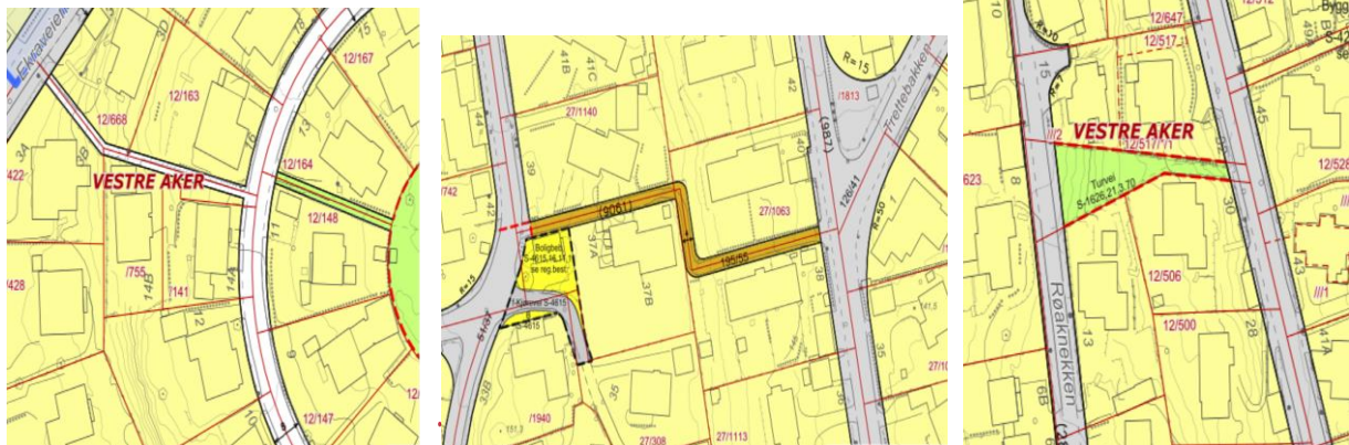
Figur 10 : Røa terrasse – Ekraveien (venstre); Bjerkebakken – Ekraveien (midten) og Røknekken - Røahagen (høyre)

På Røa har vi en rekke snarganger og smett som forbinder ulike veier og boområder og som forenkler mobiliteten for gående og syklende. Imidlertid er mange av disse i dårlig forfatning og lite kjent. I Røa Vels arbeid har vi både hatt og fremdeles har spesielt tre av disse på arbeidsplanen. I 2021 planlegger vi videre å få gjennomført noen forbedringer på enkelt av snargangene.