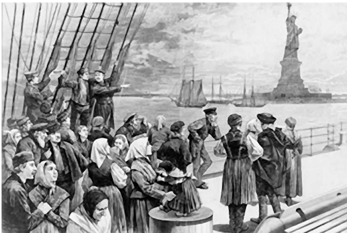
Ellis Island med Frihetsgudinnen i bakgrunnen