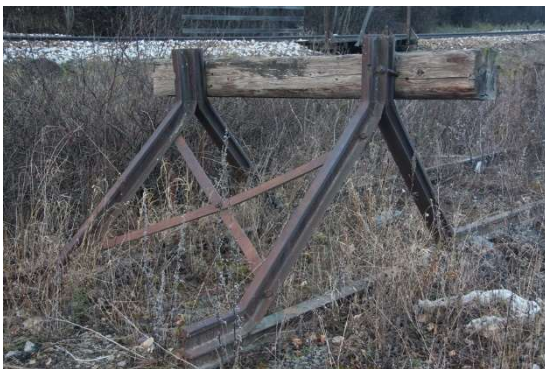
Vår stoppbukk på Otta

I uke 46 regner vi med at prøvegraving for undersøkelse av grunnforholdene blir gjennomført. På bakgrunn av dette skal det utarbeides en geoteknisk rapport som skal legges ved byggesøknaden til kommunen. Deretter skal det innhentes anbud fra entreprenør på utskifting av masse, omlegging av en del av Sagstien og etablering av steinfylling for den ene halvdel av toglinja. Den andre halvdel vil bli bygget med peler tilsvarende brua fra 1852. Alt skal stå på tørt land.