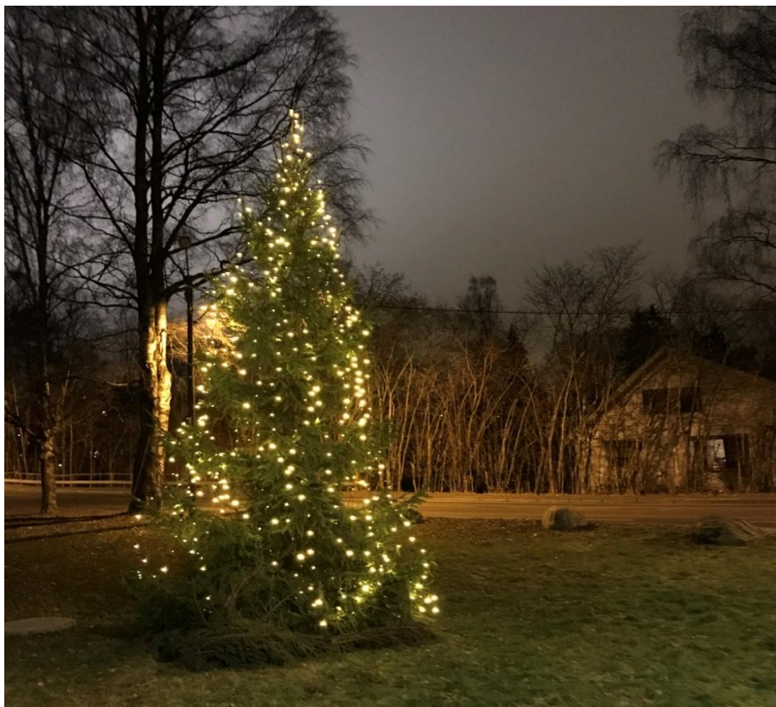
Julegranen kom selvsagt på plass selv om vi ikke kunne møtes til julegrantenning som vanlig.

Siden mulighetene for sosialt samvær ble sterkt redusert i adventstiden, ønsket vi som vel å gi våre medlemmer en liten oppmuntring. Dette gjorde vi i form av en julekort-hilsen som ble lagt i alle postkasser i vårt område. Så håper vi at det blir mulig å samles på gamlemåten igjen første søndag i advent i 2021.