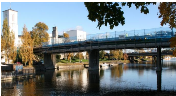
20. Rådhusbroen Tidligere riksvei – ”Sandvika bru 1934”