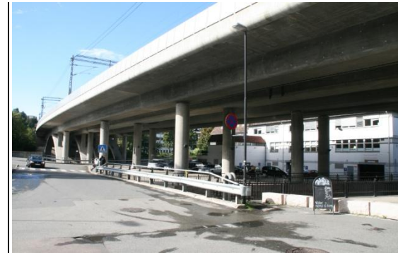
17. Jernbanebroen (i 2 deler) ble ikke navngitt av Bærum kommune