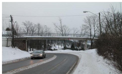
25. Evjebakken gangbro krysser Brynsvn