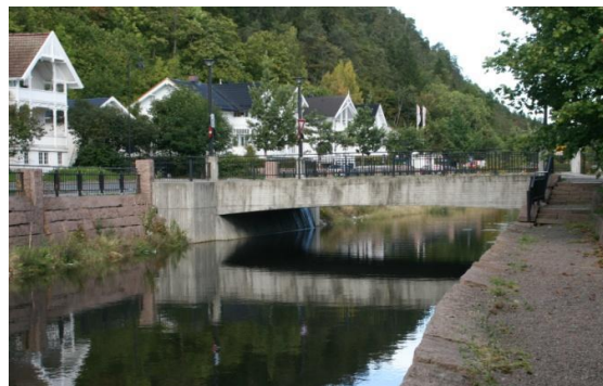
2. Gustav Lund-broen