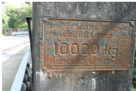
7. Hamang bro – Veibanen i Bjørnegårdsvingen (tidl. Ringeriksveien)