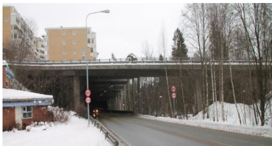
26. Hamangskogen bro i Eyvind Lyches vei der den krysser Brynsveien