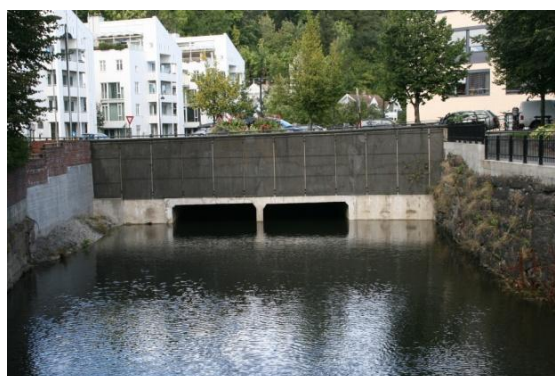
4. Rønne bro (historisk veidrag/bronavn)

Disse to broene er samme veikulvert: Tronstadbroen oppstrøms ved Leif Tronstads plass. Rønne bro nedstrøms – veibane i Willy Greiners gate.