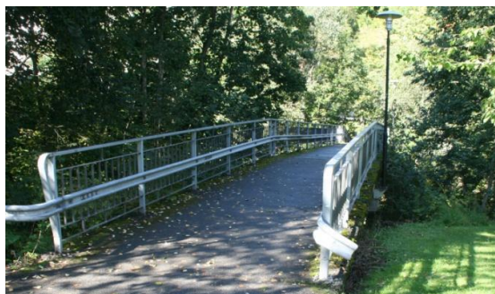
12. Kontorbroen gml gangbro fra Sandvika vgs til Hamang-området