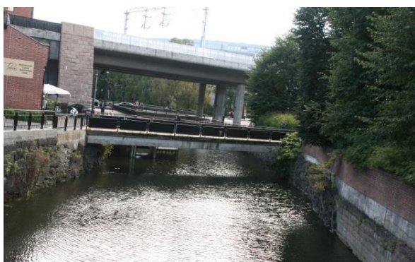
5. Løkketangen gangbro Fra Rønne park til Løkketangen senter

Disse to broene er samme veikulvert: Tronstadbroen oppstrøms ved Leif Tronstads plass. Rønne bro nedstrøms – veibane i Willy Greiners gate.