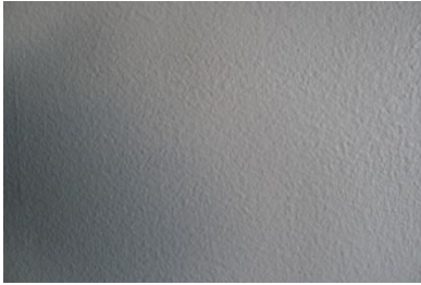
14. Prosjekt gangbro fra Kjørbotangen til Skytterdalen