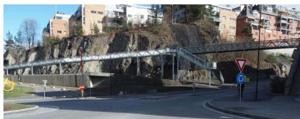
29. Kjørbo Vest gangbro – fra Kjørbo Vest til Sandvika, nordøst i Kjørbokollen