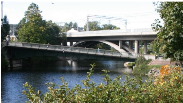
18. Tangen bro Veibanen nederst i Claude Monets allé