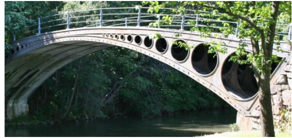
15. Løkke bro