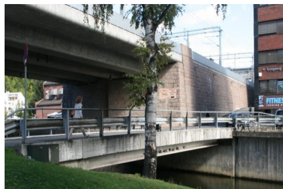
6. Løkketangen bro - Veibanen i Løkketangen