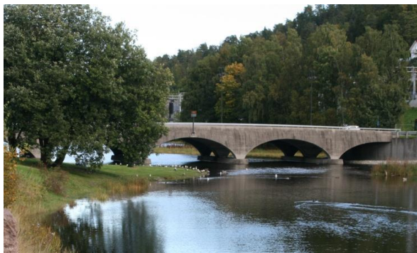
1. Folangerbroen – over Engervannets utløp