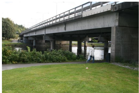
21. Motorveibroen (skal rives) ble ikke navngitt av Bærum kommune