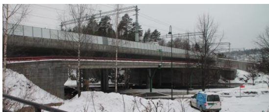
27. Jongsåsen gangbro parallelt med jernbanen