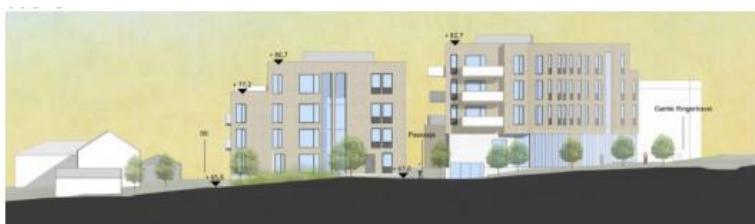
Oppriss av fasadene mot Kleivveien

En utbygger har som kjent kjøpt tomten der den lille gule dyrematbutikken står, og utbygger planlegger tre blokker med 46 leiligheter. I skrivende stund er saken «Gamle Ringeriksvei 30 m.fl. - detaljregulering - 1. gangs behandling» satt opp på agendaen for planutvalgets møte 11. mars. Bekkestua Vel sendte i oktober 2020 et brev til Bærum kommune der vårt budskap var at utbyggingen bør skje mer i tråd med de tilbakemeldinger utbygger tidligere hadde fått både fra reguleringssetaten og fra planutvalget. Vi så nemlig at utbygger stadig la