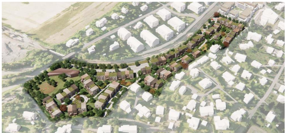
Bildet er hentet fra kommunens hjemmeside. Bildet er ikke oppdatert med de politiske føringene om at 100-meter skogen skal reddes.

Akkurat nå pågår vurderinger og undersøkelser av overvann- og flomsituasjon. Blant annet som en følge av dette vil kommunedirektøren foreslå at barnehagen tas ut av planforslaget. Når dette er løst vil planforslaget bli fremmet til annen gangs behandling i planutvalget. Planen er at dette skjer etter påske. Deretter vil planforslaget kunne vedtas av kommunestyret tidligst før sommeren 2021.