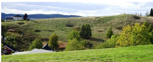
De siste bombekraterene ved Kjeller.

Er blitt en aktivitet som engasjerer mange. Her er det gode muligheter for historielagene til å delta med presentering av lokalhistoriske kulturminner.