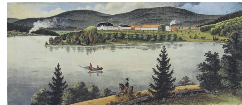
Malt av Gustav Lewenhaupt fra Utsiktsskollen i 1809

Lewenhaupt levde «glade dager» sammen med Peder Anker og tegnet og malte sitt «eget fengsel», nettopp fra Utsiktsskollen.