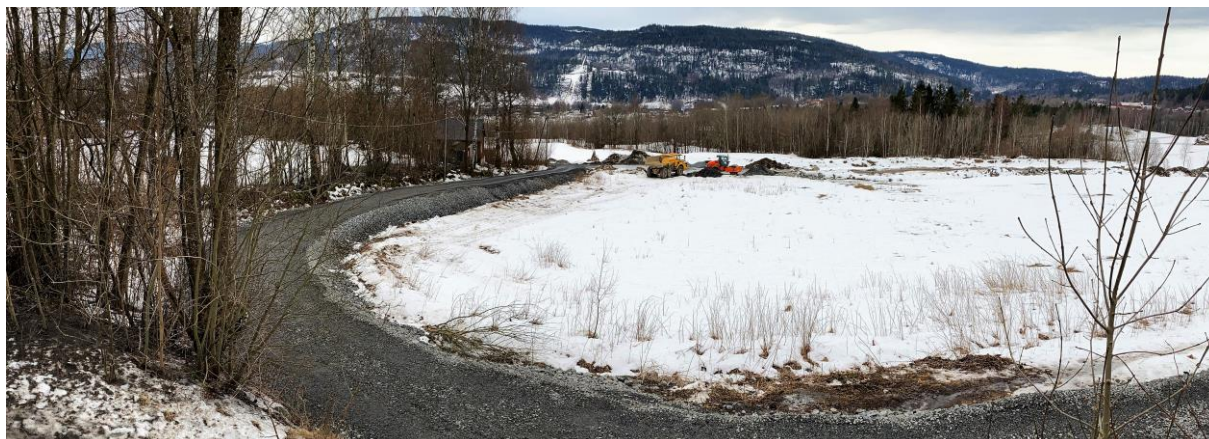
Områdene i Busoppveien 22 ser mest ut som et stort anleggsområde. Mange har tvil om området er mulig å bringe tilbake til det det en gang var.

Vellet har representanter i styret for Rykkinn Frivilligsentral og S sammenslutningen Rykkinn Grendehus.