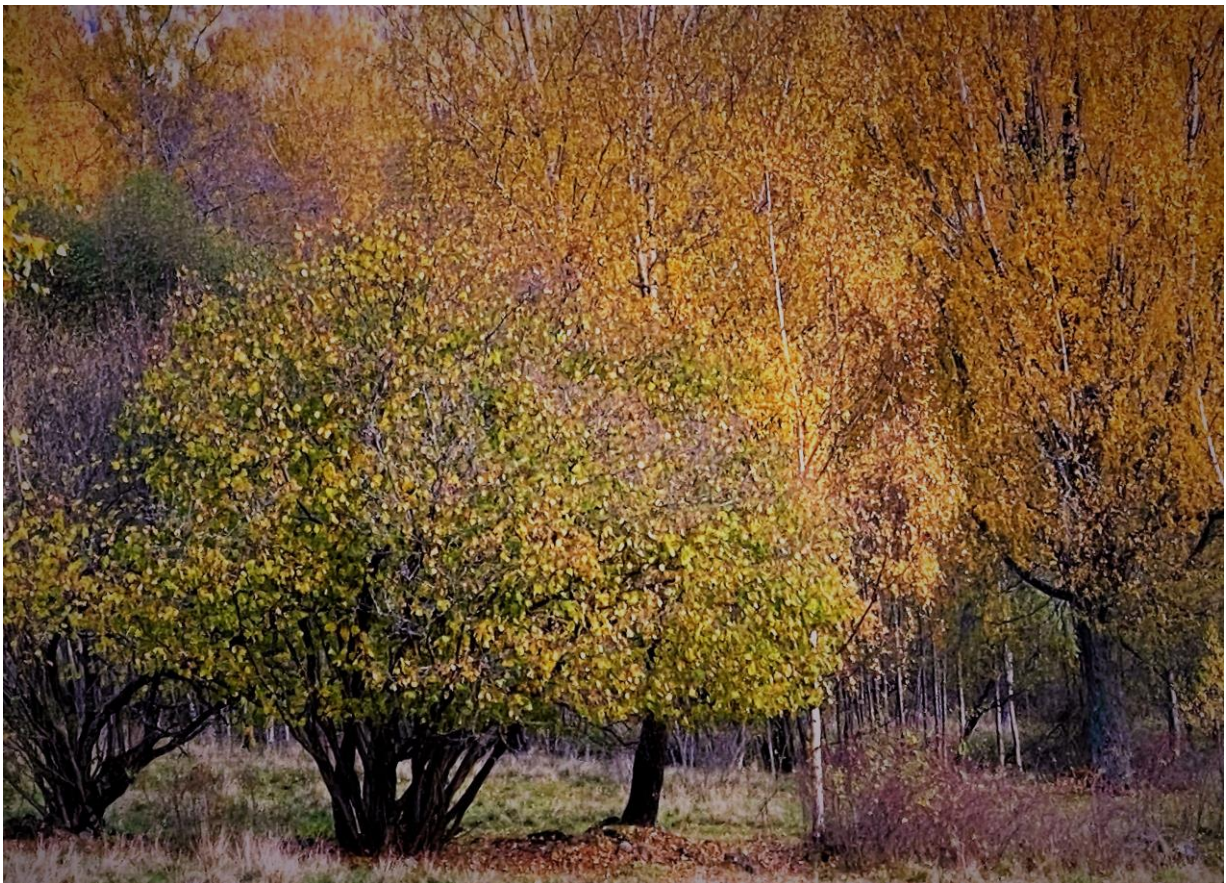
Langs turveier på øvre Rykkinn.