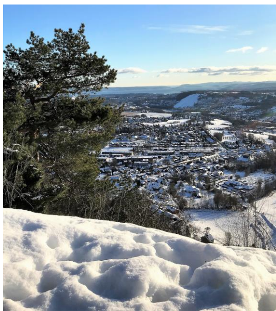
Fra Solfjellstua.

Velstyret har også i år ytt støtte til tiltak som er viktige for barn og unge. Også arbeidet for å beholde friluftsområder i nærområdene styrker oppvekstmiljøet. Det er god kontakt med