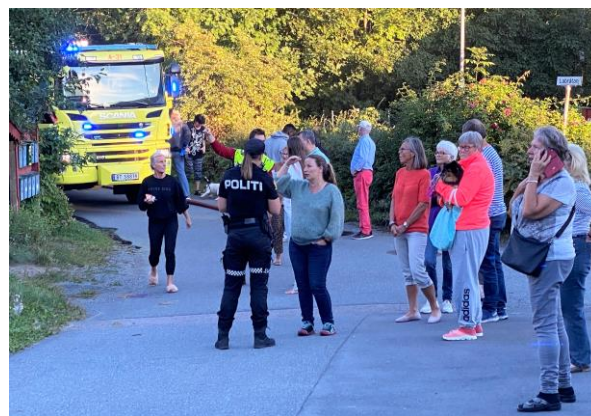
Trangt om plassen når brannbilene skal fram på smale veier.

På grunn av koronasituasjonen har det ikke vært gjennomført fysiske møter etter 12. mars med unntak av desember-møtet. Drøftinger har skjedd i digitale møter knyttet til saker som er omtalt andre steder i beretningen.