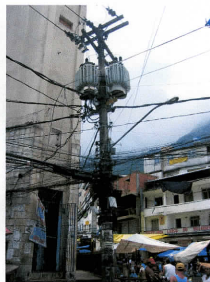
Foto fra: Reistadjordet, nedre del fra 2008 og fra: favella i Rio de Janeiro 2005

I de nye byggefeltene i Asker ligger alle kabler usynlig i bakken.