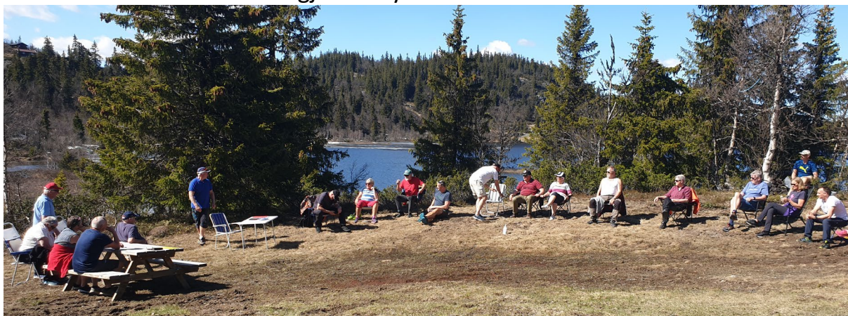
Fra årsmøtet 30. mai 2020 i forskriftsmessig koronaavstand

Ut over dette har styret hatt regelmessig kontakt på telefon og epost i forbindelse med saker som gjelder hyttevevet sin aktivitet.