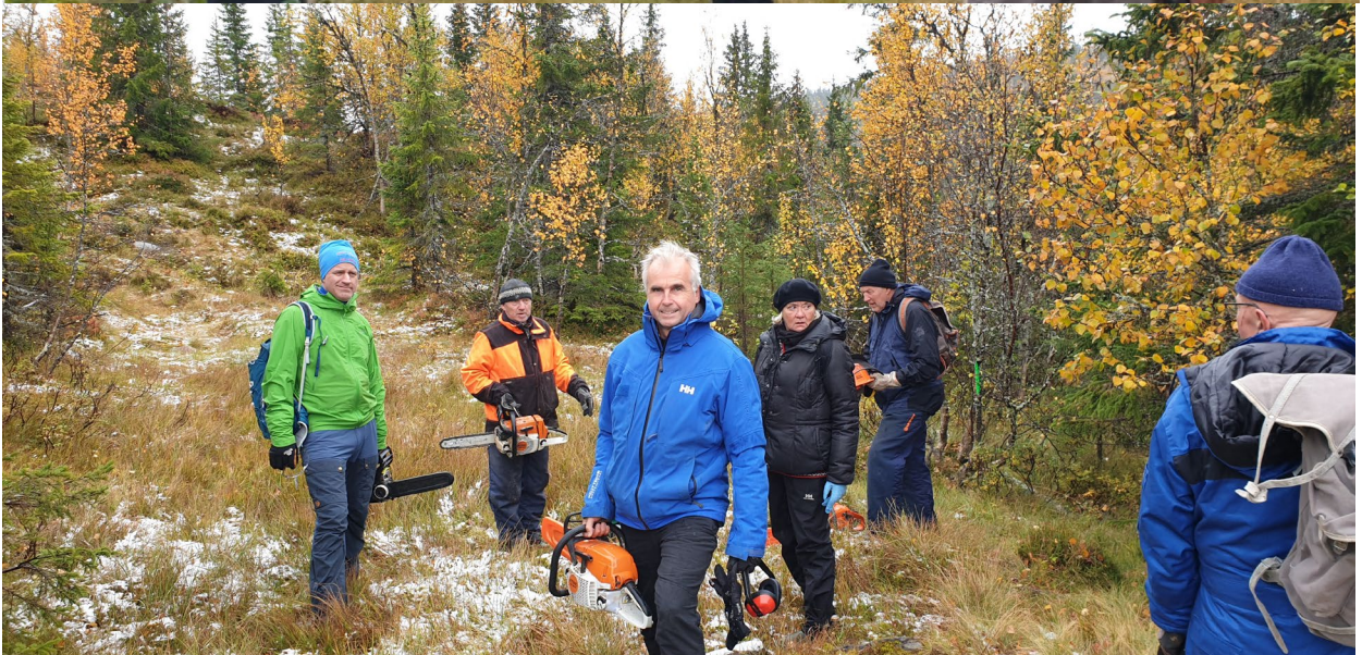
Fra løypedugnad 26. september 2020

Det som før vært flere saker som har engasjert mange i hyttevevet. Det dreier seg om skiløyper, strøm, vann, telefondekning, sommerstier, gjengrodde vann, strøing av vintervei, automatisk bom, samarbeid med grunneierlaget