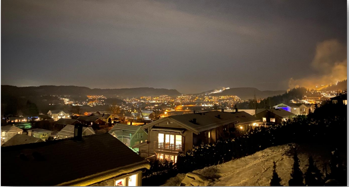
Også Lommedalen og Bærums Verk urbaniseres