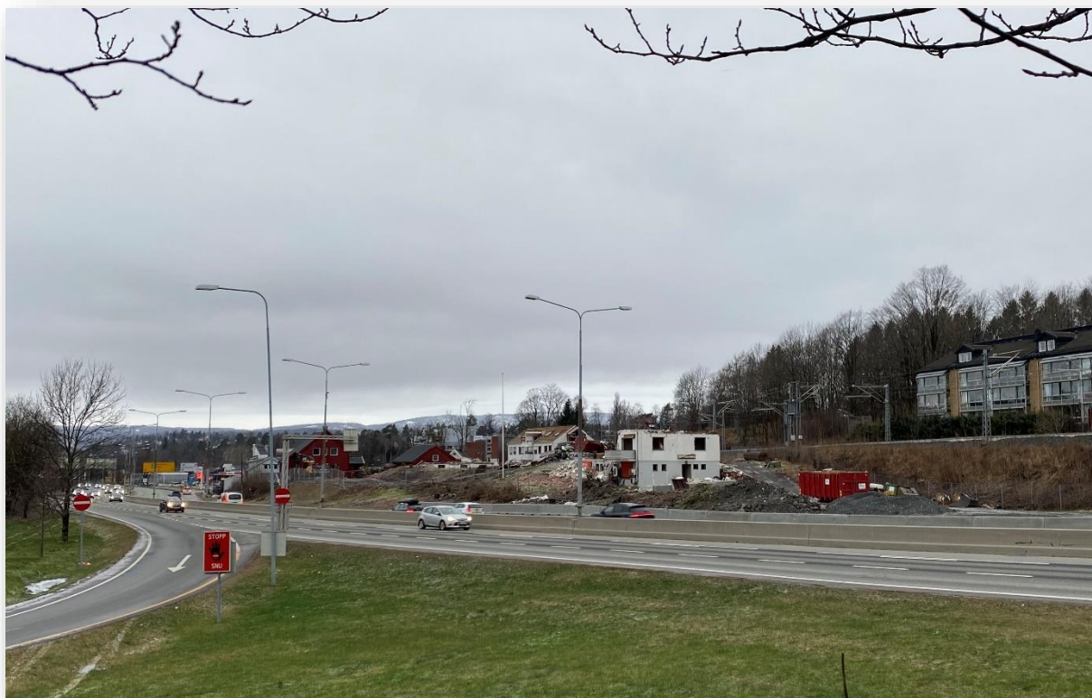
Taxisentralen måtte vike i forbindelse med oppstart av anleggsarbeid på ny E18

Årsmøtet slutter seg til forslag til arbeidsprogram for styret i Bærum Velforbund 2021.