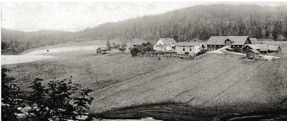
Postkort fra Dahl i Hærland. Den gang ble det skrevet med h, kanskje uvitenhet fra postkortprodusenten Mansrud.