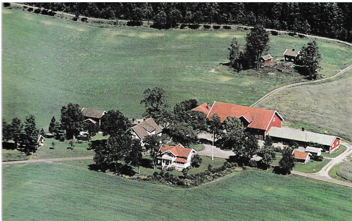
Flyfoto av Dal gård i Hærland, vakker gammel slektsgård med en interessant og sterk historie om menneskene som har bodd der.