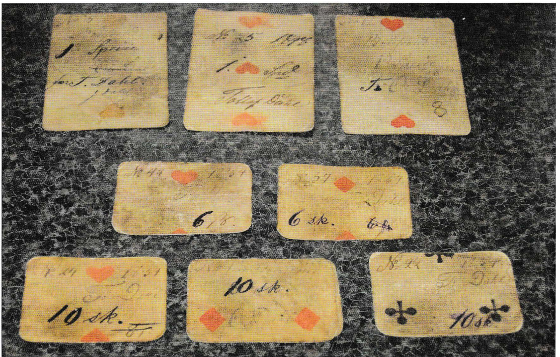
De hadde et eget privat pengesystem på Dal. For utført arbeid fikk arbeiderne et lite kort av papp med hva de hadde til gode. Husmennene samlet på disse kortene, og ved årsoppgjøret kunne de se hvor mye de hadde til gode.