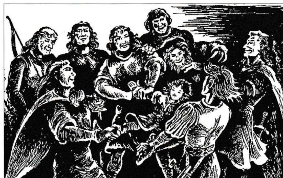
Birkebeinerne leker med Haakon. De trakk i ham for å få han til å vokse fortere.

Det er disse ord som er hogget inn i minnesteinen på Folkenborg: Konungr ok Herre ok Felag.