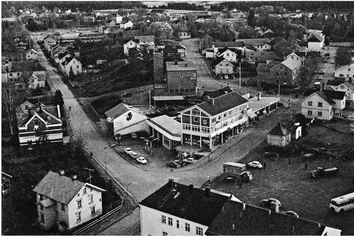
Gata til venstre i bildet er Smedgata. I forgrunnen til venstre ser vi Aas-gården og det gamle apoteket hvor fotograf Grinna holder til i dag.

høypose hengende over nakken så de fikk litt mat, og om vinteren fikk de et fint teppe over ryggen. Vi gikk ofte den veien fra Smedgata og opp i Mysen, og jeg husker ennå duften av svette hester, små vrinsk og «humring» fra de fornøyde trekkdyra. Det er en beroligende og god opplevelse å minnes.