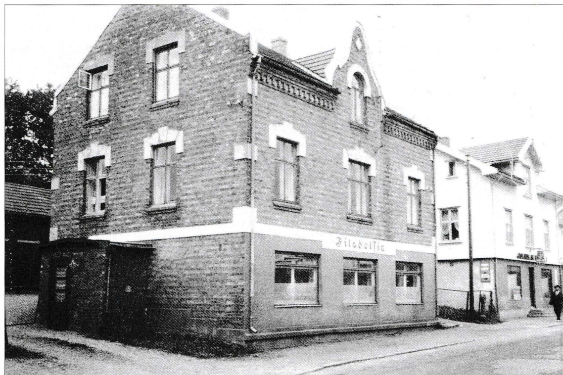
Filadelfia, pinsevennernes tidligere møtested i Smedgata før de flyttet til Opsahljordet.

Det skjedde jo noen episoder i søndagsskolen som sitter ennå. Vi hadde en liten figur av en mørkhudet gutt. Han hadde ei stor fremstrakt hånd som vi kunne legge en mynt i, og ved å vri på øret hevet hånden seg opp til munnen slik at mynten ble «svelget». Dette var en gave til sultne barn i Afrika. Under et