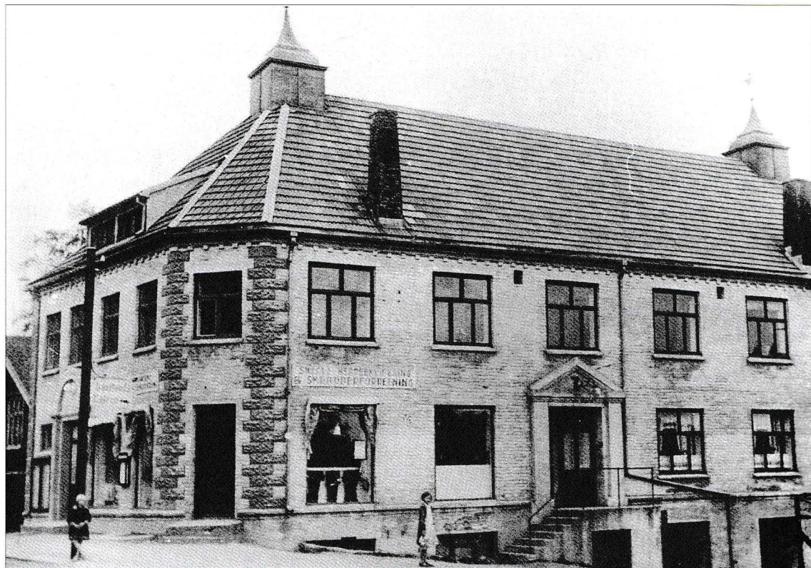
Arbeidersamfunnet som var det store samlingsstedet i Mysen med kinoforestillinger, boksestevner og ikke minst revyer.

salg der i kinogangen. Da hadde jeg et brett på magen med mye rart i, og salget gikk bra. Jeg fikk noen kroner i lønn og gratis inngang til kinoen. Da var det om å gjøre å få plass på galleriet med oversikt over salen. Det var alltid fullsatt forestillinger. Vi må huske på at dette var før fjernsynets tid. Den gangen klarte vi oss med en radio hjemme og kino om søndagen.