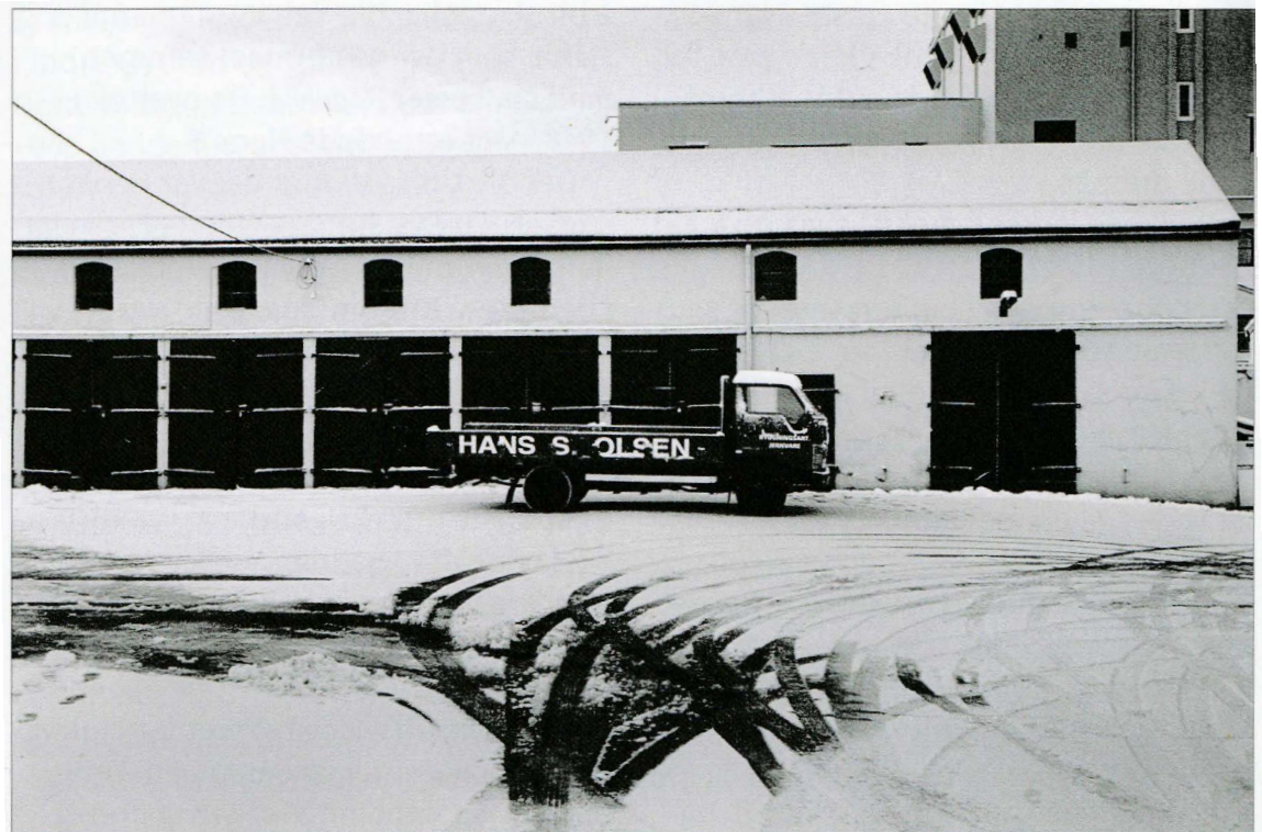
En av de to lagerbygningene fra 1930-årene. Bildet er tatt samme dag som forretningen opphørte i des. 2011. Tidligere lå det et Esso tankanlegg med oljebu akkurat i fremkant av bildet.

Etter krigen lå både bensinstasjonen og engros-lageret på seg i salgsvolum og kundekrets. Firmaet satset på egne tankbiler for bensin og olje, og traff et voksende marked. Det ble også bygd skikkelig bensinstasjon knyttet til Esso. Den hadde tre pumper: til vanlig bensin, ekstra bensin og diesel. Stasjonen lå midt mellom det gamle