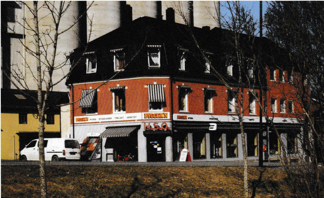
Forretningsbygget med litt av et lagerbygg bak. Mysen postkontor var leietager i bygget fra 1921–1933