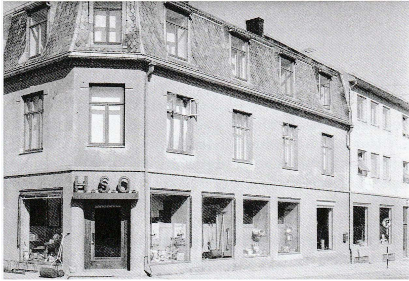
Forretningsbygget slik det fremsto i 1958. Legg merke til brosteinen! Den har preget Mysen-gatene i en årrekke, inntil moderne asfalt fikk overta.

I stedet åpnet han i 1914 byggvareforretningen som etter hvert ble en av de større spesialforretningene i Østfold.