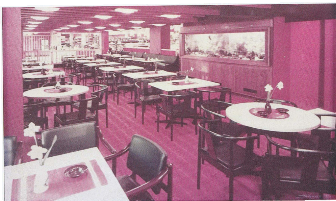
Kafeteriaen etter nyåpning 1975. Saltvannsakvariet bak til høyre.