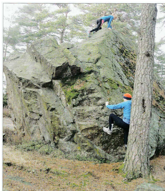
Trollkjerka i Kirkås.

foreldre ville nok ikke bifalt det (om de hadde visst) at vi av og til «lusket» oss inn mot Trollkjerka for å se om det var noen overjordiske leieboere der. Én gang ble vi observert av en av disse overnatterne som kjeppjaget oss med trusler om at det ville gå oss ille om vi våget å vise oss én gang til. Og selvfølgelig våget vi det!