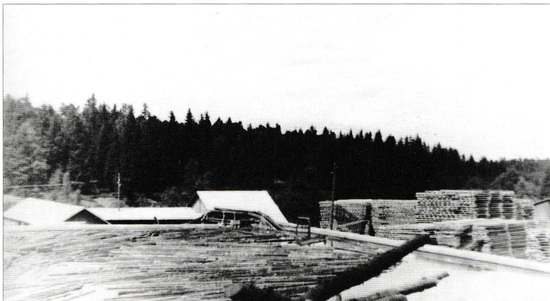
Hoveddammen som skapte «Nødammen», ble bygd i 1916. Tømmeret gikk fra dammen og rett inn på velta gjennom åpningen i midten. Damluka til høyre

av 1700-tallet var en økonomisk gullalder for dobbeltmonarkiet. Det var fred. Det var stabile styrer som forsto å bruke de rigide privilegieformene fra fortiden på måter som skapte rom for økonomisk handlekraft blant de privilegerte borgerne.