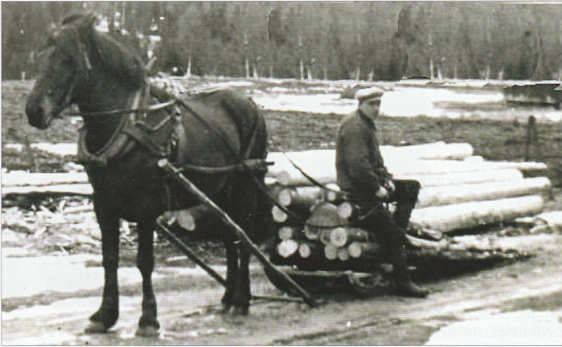
Kåre Lund kipper med bare bukk.