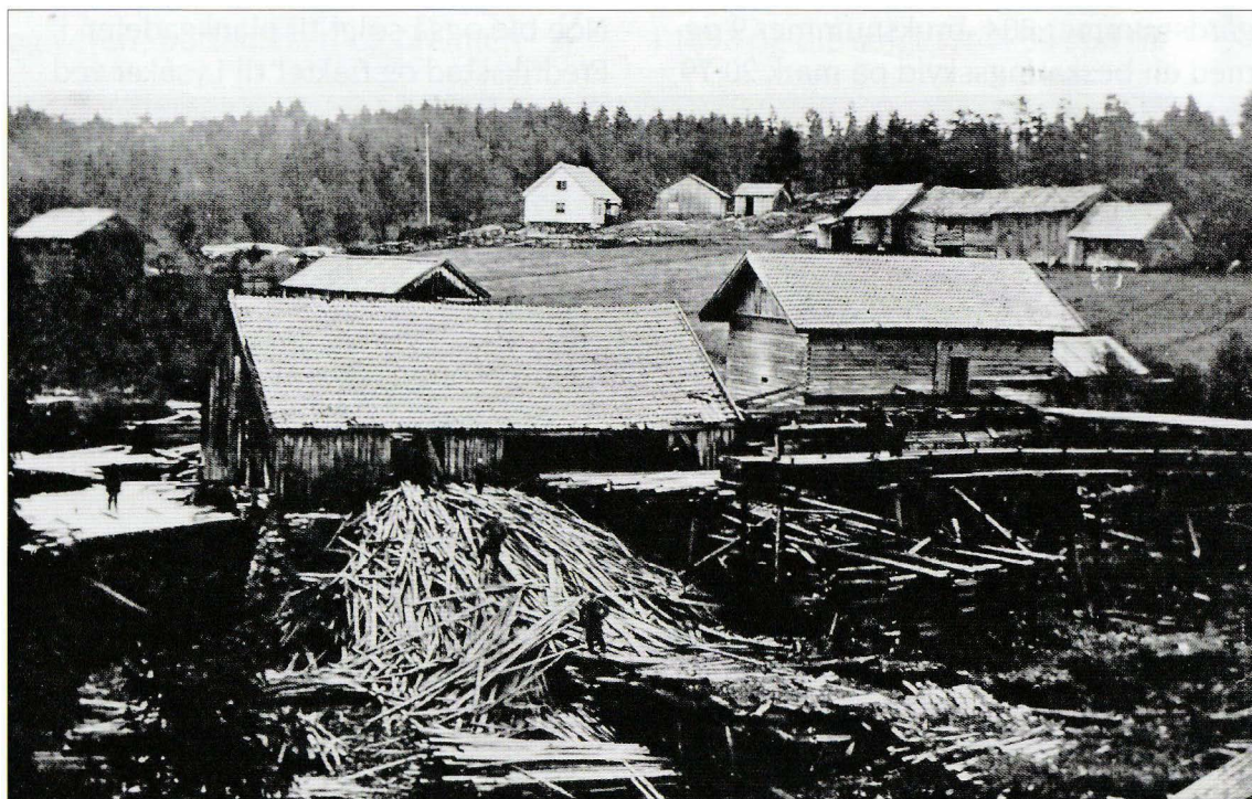
Bruget sett fra vest og mot nord-øst, rundt 1920

I 1818 ble det også bestemt at det skulle opptas en ny matrikkel over grunneiendommenes skatteskyld på landet. Dette startet en prosess som gjorde slutt på den gamle utydigheten rundt skogstrekingene som uspesifiserte