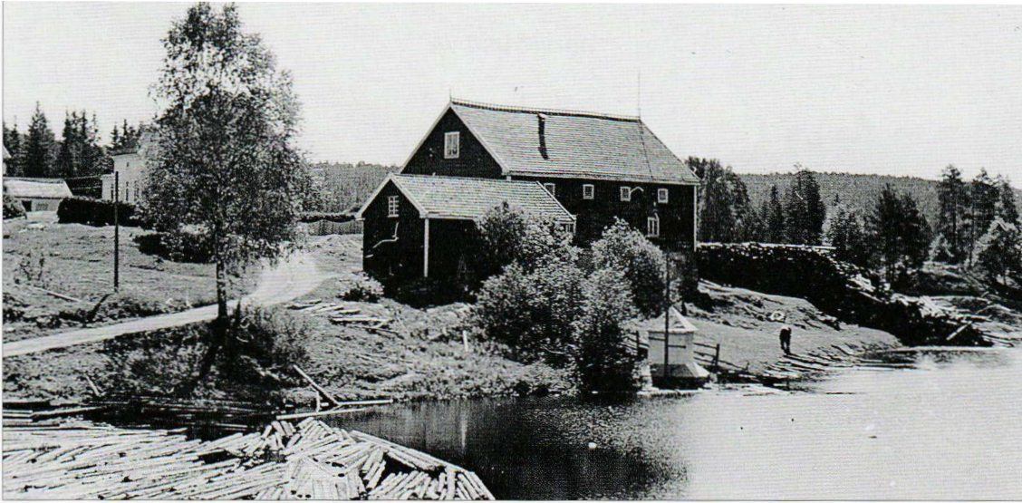
«Tørdammen» og gårdshusene sett fra taket på saghuset, før 1950. Tømmeret ble veltet ned i dammen, fløtet til damåpningen og rett inn på sagvelta. Kjerraten nedenfor dammen ble bygd ca 1950. Fra da av ble tømmeret veltet nedenfor dammen og inn på kjerraten som fraktet stokkene inn til saga

slik sag hadde sine makskvanta av bord som kunne skjæres hvert år. Uprivilegerte sager, som stort sett var bondesager, kunne bare sage ukantede bord til eget bruk, og til avsetning i eget bygdelag. Slik sank bøndenes del av sagbruksvolumet fra rundt 85% på begynnelsen av 1600-tallet, til rundt 4% ved århundrets slutt.