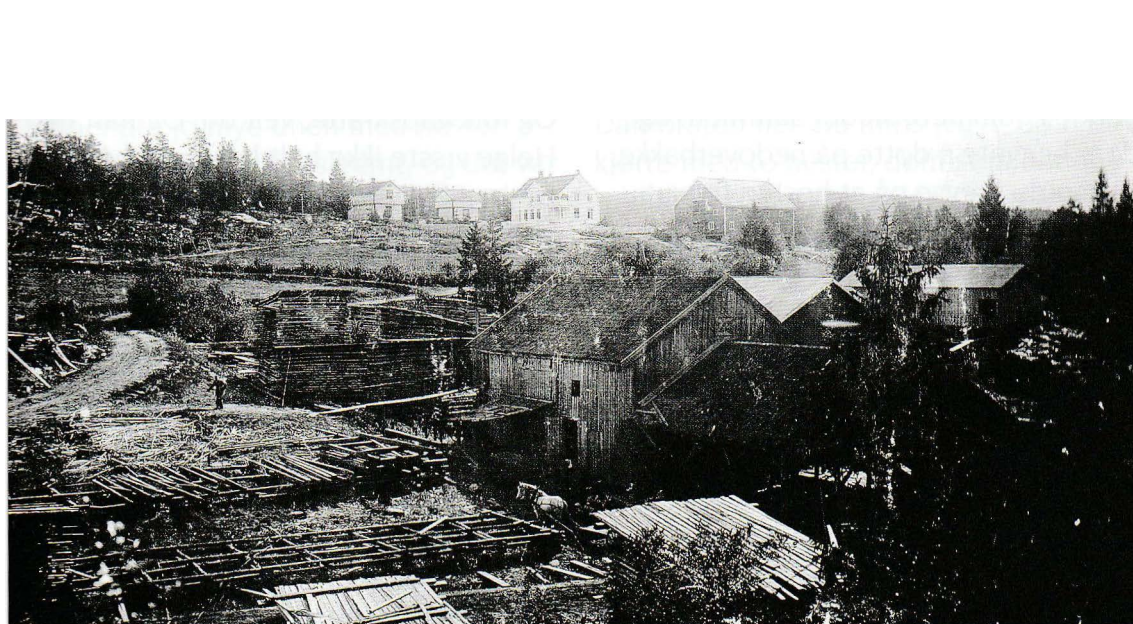
Svarverud bruk sett fra vest mot øst, rundt 1910

Årsakene til verdistigningen var mangesidige. Viktigst var de gode tidene i Danmark-Norge. Den siste tredjedelen