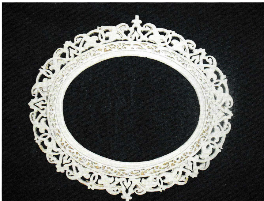
Lille Georg viste tidlig at han behersket kunsten å arbeide med tre. Allerede som 12-åring laget han vakre løvsagarbeider.

Lille Georg var så visst ikke født med en gullskje i munnen. Han vokste opp hos en pleiefamilie i Trøgstad, og etter konfirmasjonen måtte han, som de fleste ungdommer på den tid, ut i arbeidslivet. Som 15-åring startet han som husmaler.