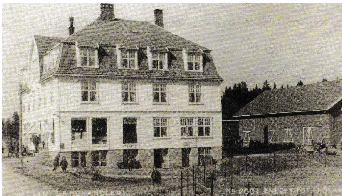
Slitugården inneholdt melkemottak, café, bakeri, landhandleri, postkontor samt sju leiligheter i 2. og 3. etasje. Gården ble skadet under spregningen Splinter fra banelegemet traff Slitugården En av dem gikk gjennom veggen og inn i soverommet i 2. etasje.