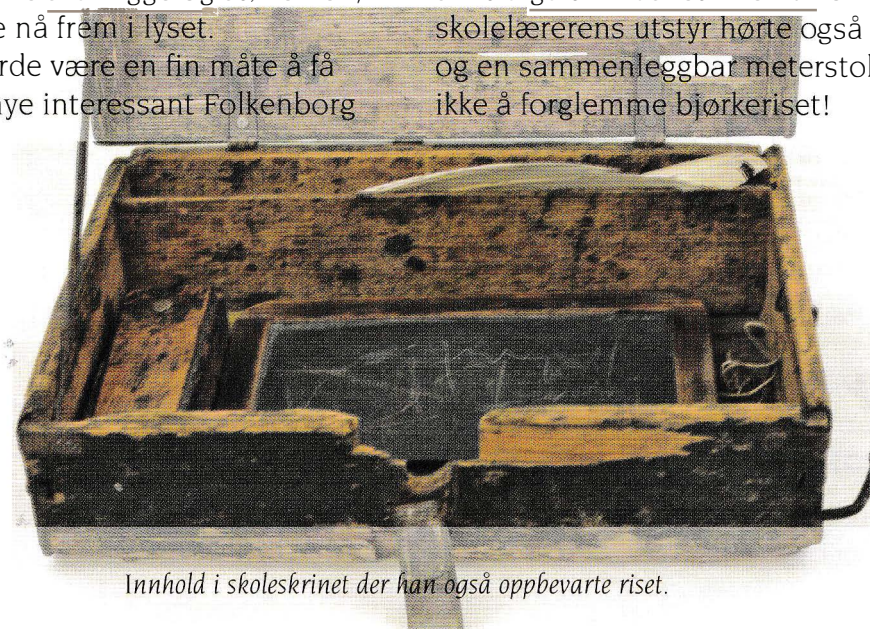
Innhold i skoleskrinet der han også oppbevarte riset.