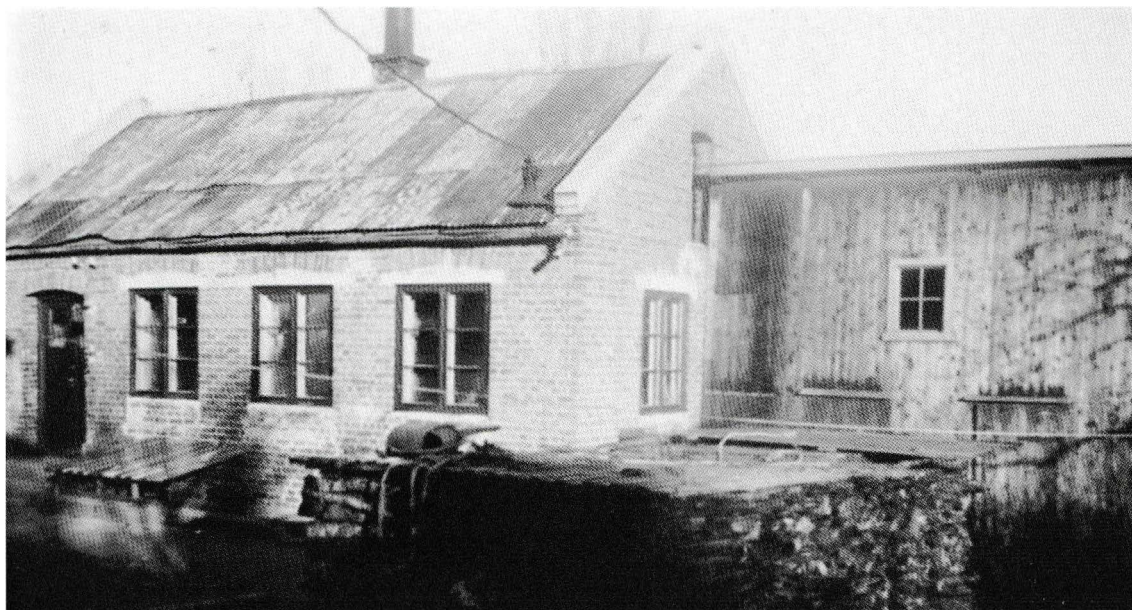
Korperud snekkerverksted i Fabrikkeveien

serien, designet av Adolf Relling. Da disse hovedproduktene sviktet, hadde ikke bedriften gode nok produksjonsalternativ og det ble en gradvis nedtrapping av bedriften frem mot det siste århundreskiftet.