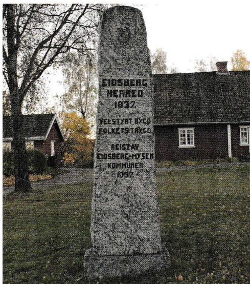
Minnesteinen på Folkenborg museum.