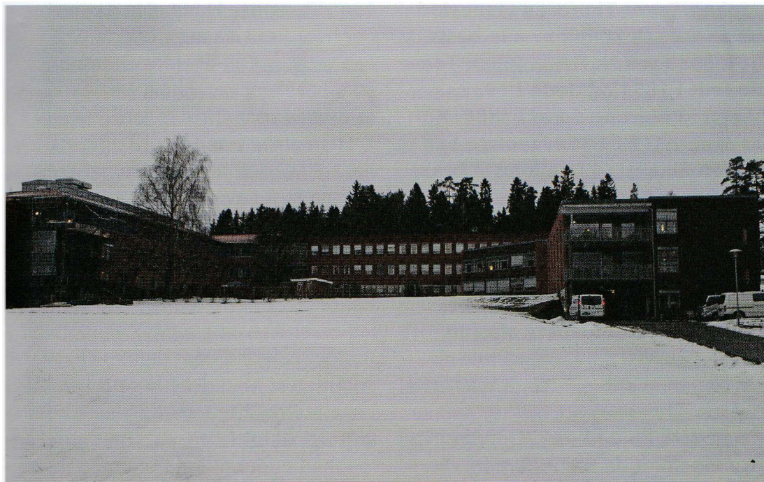
Edwin Ruuds omsorgsenter desember 2011, snart klar med 24 nye sengeplasser.

Som avslutning kan vi se litt på hospitalets drift i dag og i tiden frem-over. Først kan vi slå fast at Askim ikke er med i driften lenger. Sykehuset Østfold og Eidsberg kommune disponerer hele byggemassen på følgende måte: Sykehuset Østfold har psyki-atrisk senter (DPS) for Indre Østfold. Eidsberg kommune forvalter Edwin Ruuds omsorgssenter som er delt på 80 sykehjemsplasser og 33 omsorgsboliger. I tillegg har kommunen under oppføring en 3. etg. med 24 syke-hjemsplasser. Disse skal i første omgang ta i mot pasienter fra Fossum-bokollektiv når dette nedlegges.