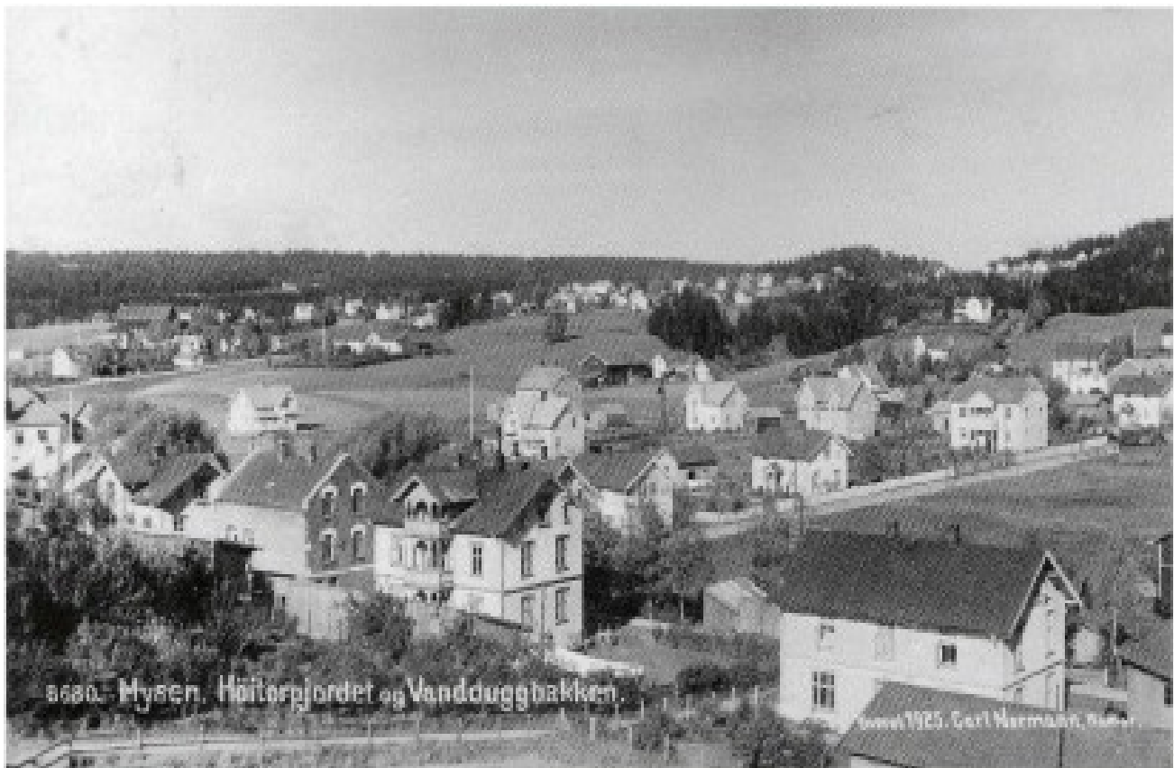
Postkort fra 1925 med Smedgaten, Høytorpjordet og Vandughakken

Å komme dit, var som å komme til det store utland i dag. Vi reiste med buss, og ble mottatt på beste måte: Vi marsjerte i gatene i våre drakter sammen med de svenske spillerne, og etter kampen fikk vi flott middag på