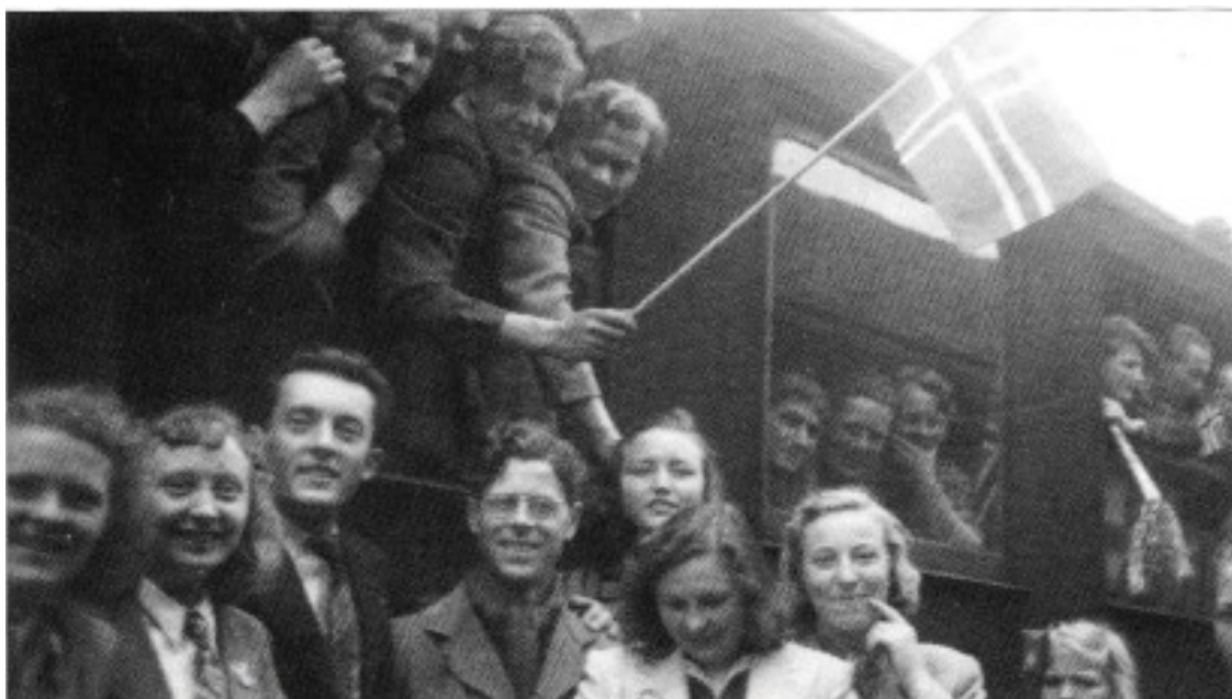
Mysen jernbanestasjon under frigjøringsdagene i mai 1945. Hjemreise for «Momarkenfangene»

På midten av 50-tallet bygde far hytte ved Rødenessjøen. Fra den tid slappet han mer av i forhold til forretningen, og han hadde sin daglige tur til den kjære hytta si. Det hendte til og med at han var der to ganger om dagen.