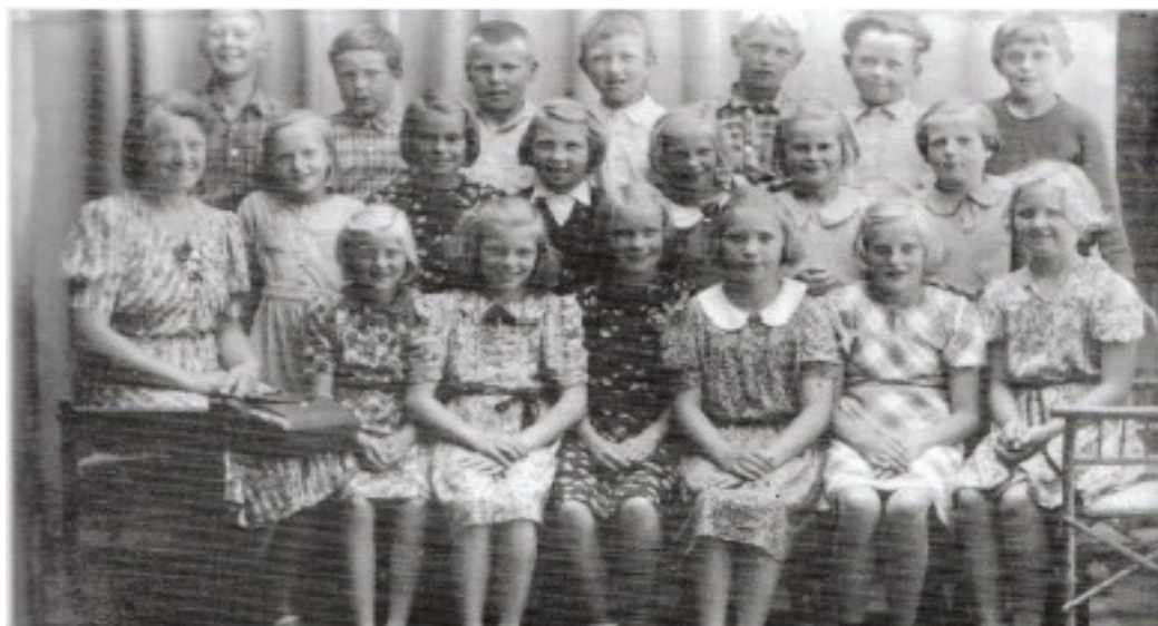
Folkenborg skole, 3. klasse 1939

På pulten var det plass til blekkhus og pennal med et lite rom under pultplata til skolebøker. Bak kateteret var tavla med pekestokken og svampen til å pusse av tavla med. Ellers var det skap til oppbevaring av blekkhus når de ikke var i bruk, samt skrivebøker og kladdebøker. Alle skolebøkene måtte vi