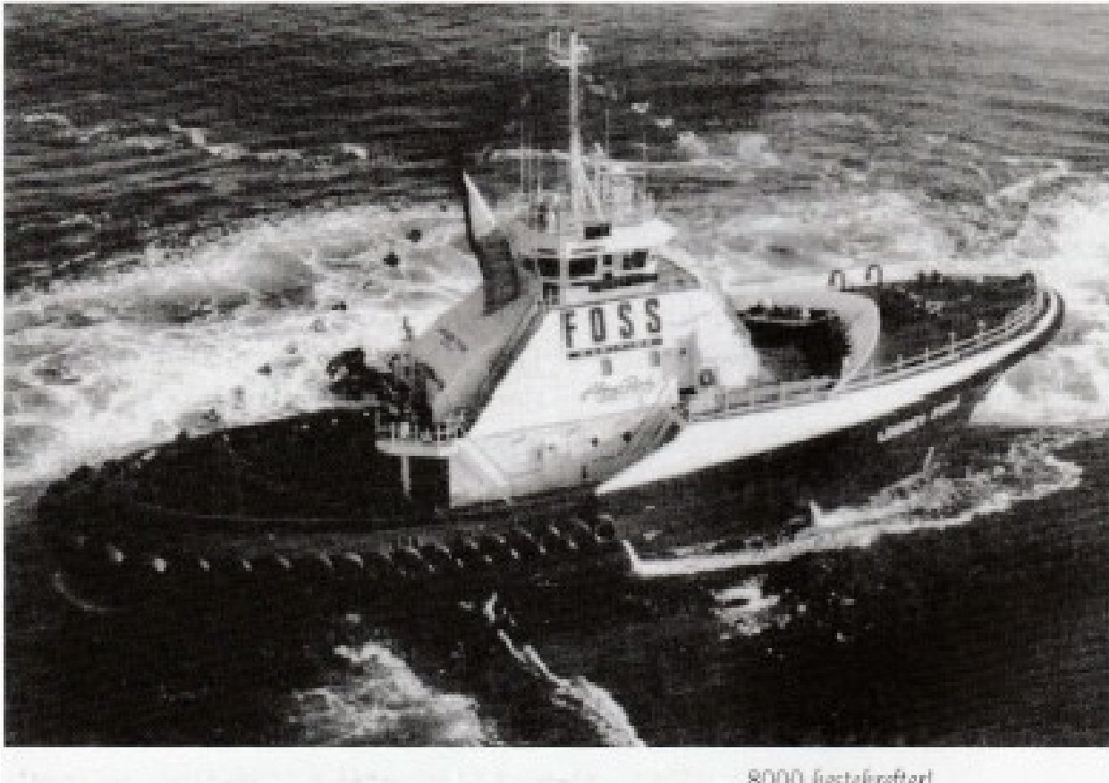
Lindsey Foss, den største og kraftigste slepebåten i verden - 155 fot og 8000 hestekrefter!

«Kundene er vår største styrke» heter det hos Foss. Om du tar en tur til Seattle, må du kikke etter de grønne og hvite båtene!