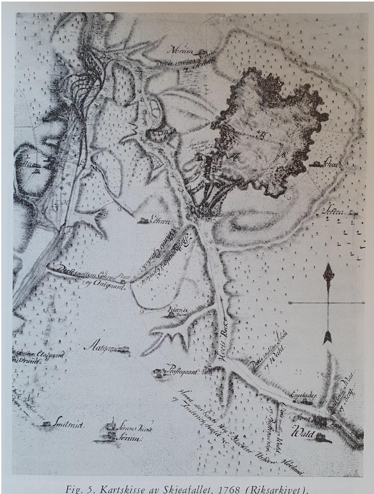
Fig. 5. Kartskisse av Skjeafallet, 1768 (Riksarkivet).

Skea fikk redusert skylden med 1 ½ skpd. Tunge, ellers oppnådde følgende garder midlertidige skattelettelser: Egner nordre, Asak nordre og søndre, Merli, Vølner, Sæteren, Haskoldrud, Sagen østre, Tangerud, Mjønerud og Vilberg Øvre. Flere kvernbruk gikk også tapt.