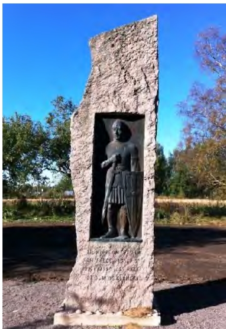
Olavsbautaen ved Skedsmo kirke

Fra forordet i mulighetsstudien: Skeidismoen er navnet på det gamle tingstedet på høyden omkring Skedsmo kirke. Her møttes gamle ferdselsveier, og Skeidismoen har vært et viktig sted fra Vikingtid og fram til vår tid. Skedsmo Historielag har hatt et engasjement for å synliggjøre historien gjennom bevaring, skilting og stevner. Dette har resultert i et «forslag til hensynssone bevaring» som er en ikke-juridisk plan. For å fremheve og ta vare på de historiske sporene, har Skedsmo historielag i samarbeid med Grindaker landskapsarkitekter utarbeidet en «Mulighetsstudie». Målet med mulighetsstudien er at den kan danne grunnlag for en juridisk kommunedelplan og vise forslag til utvikling og skjøtsel av området.