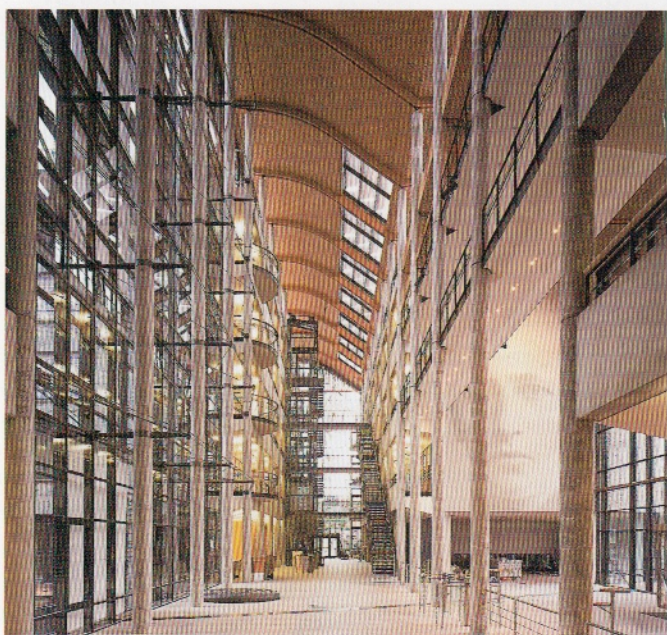
Telenorsenteret i Bergen

Det nye Telenorsenteret i Bergen ble offisielt åpnet på slutten av fjoråret. Telenor har arrangert to omvisninger for telepensjonistene i Bergen. Til sammen 170 pensjonister har vært på omvisningene.