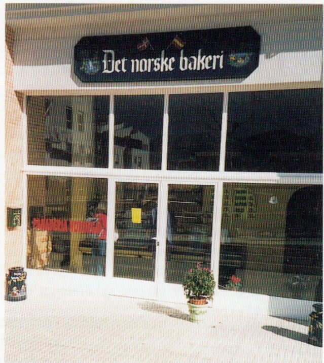
Det norske bakeri i Alfaz del Pi