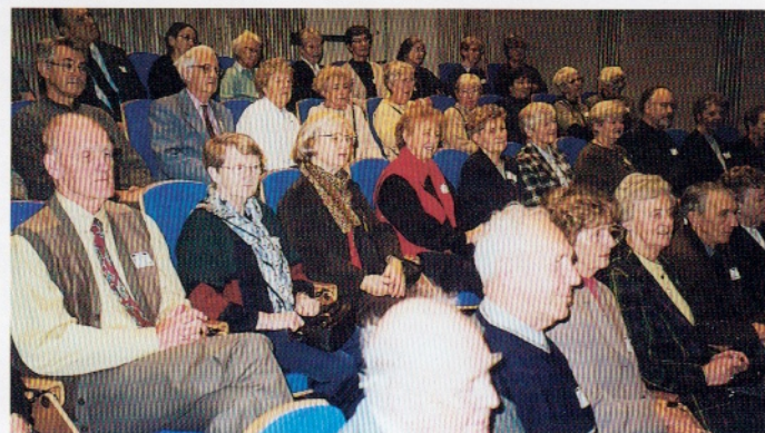
Telepensjonister på omvisning i Telenorsenteret