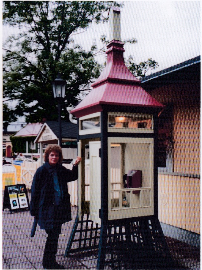
En av deltakerne prøver en original telefonkiosk i Nådendal

Vårt inntrykk av Estland var positivt. Vi ble godt mottatt over alt, bodde på et flott hotell og hadde det ypperlig. Det var rent og velstelt over alt, og med unntak av et bortkommet kamera, så vi ingen kriminalitet.