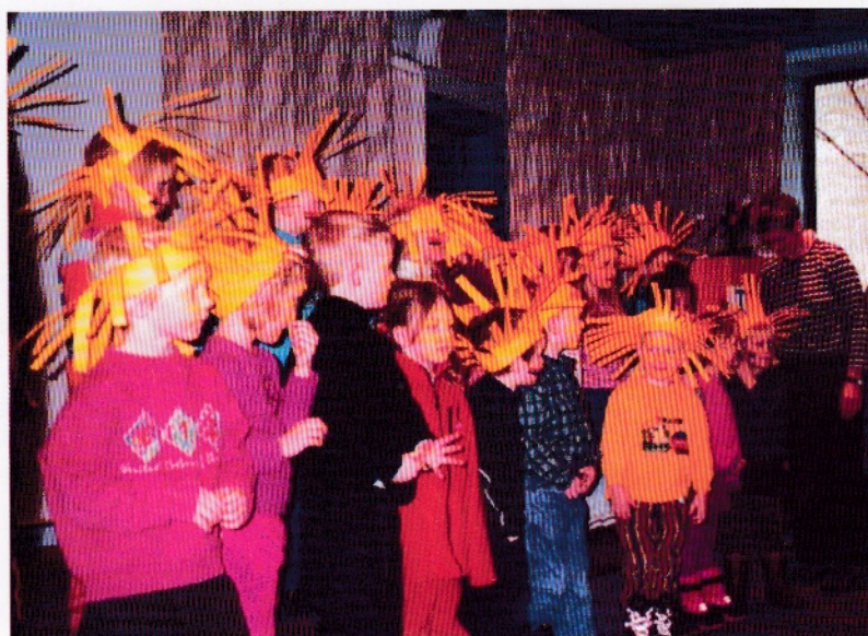
Barna i "Telenors" barnehage manet fram sola på telepensjonistenes årsmøte i Trondheim.

På årsmøtet til Trondheimsforeningen i mars underholdt barna i Telenor 'sin' barnehage på Tyholt med solkroner, teater og sang. Lite visste vi da, at de sang inn det som ble tidenes solsommer i Trøndelag. Så kom igjen og syng for oss neste år også!