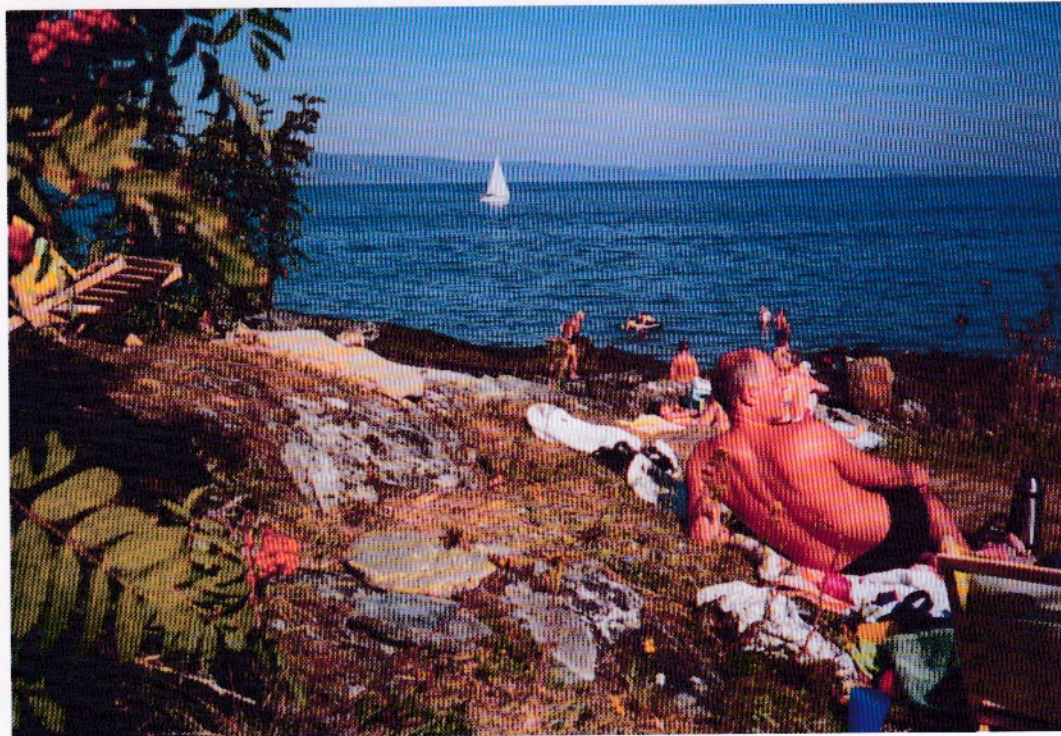
En vanlig sommerdag ved Trondheimsfjorden.

Telepenjonistene er stadig på farten. Ut og opplev andre blåner, miljøer og land, det er en drivkraft til reiseaktivitet. Tusentalls potensielle teleambassadører farter rundt i Norge og Europa i løpet av sommeren. Ikke alle mobiltelefonene teller penger inn til Telenor Mobil.