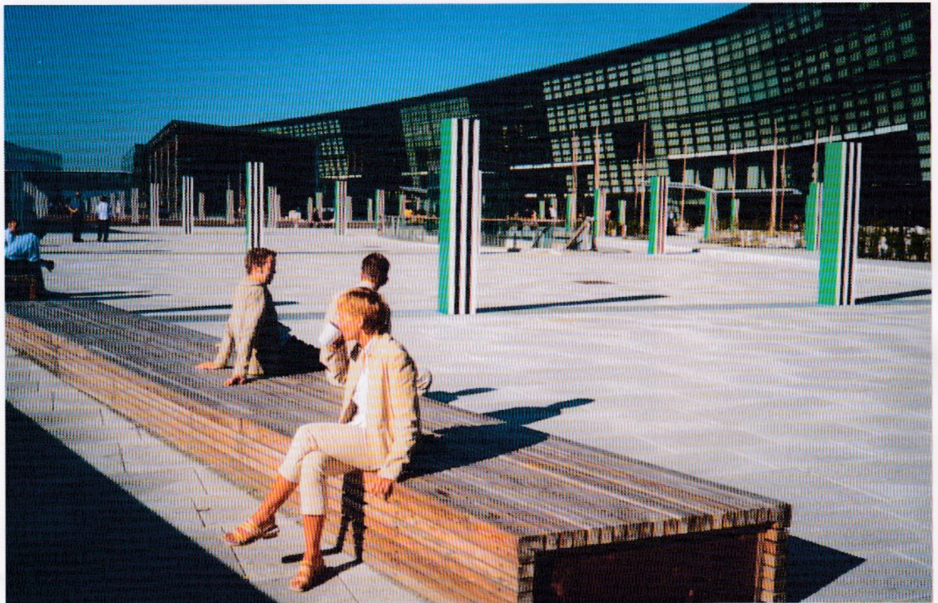
Monumentalt bygg og uteplass på Fornebu