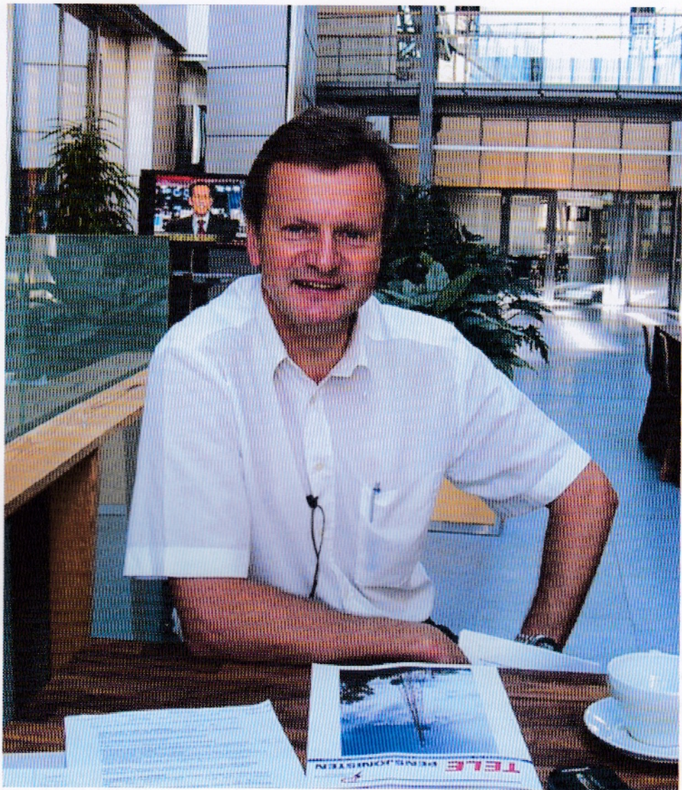
Konsernsjef Baksaa på hjemmebane med Telepensjonisten

-Alle aktiviteter koster. Den tid er forbi da vi kunne ha funksjoner som ikke fikk en prislapp. Vår kostnadsstruktur og våre kostnader er til en hver tid i